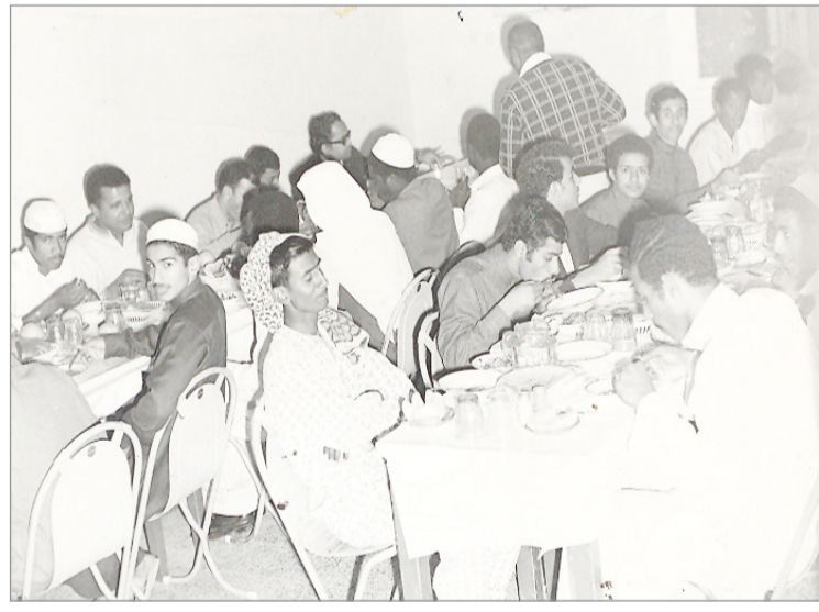
زبائن في احد المطاعم