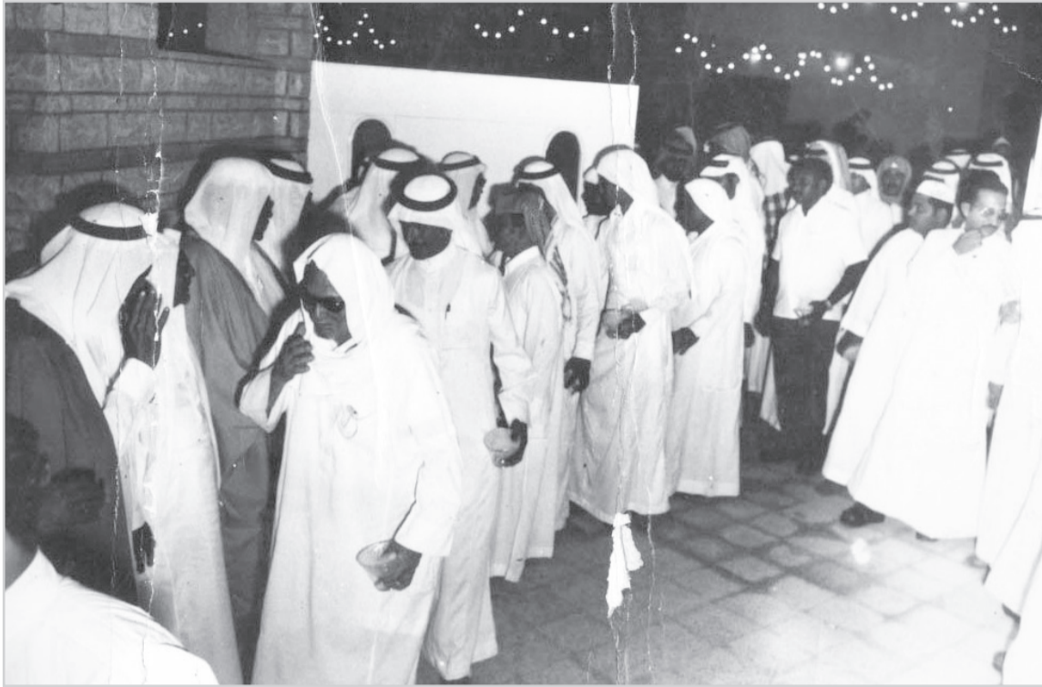
المهثؤون في احد الافراح