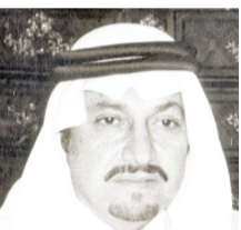
الأمير طلال بن عبد العزيز

× غادر جدة إلى الرياض أمس سمو الأمير طلال بن عبدالعزيز. × قدم من المدينة المنورة الوجهه المعروف الشيخ عبدالعزيز الخريجي والاساذ عبدالكريم الخريجي.