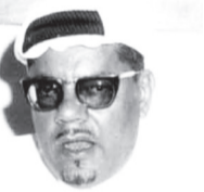
عبد الله عريف

مكة - مكتب البلاد تم عقد اجتماع هام للمجلس الاداري بأمانة العاصمة صباح يوم أمس.. فقد علم محرر البلاد بمكة ان سعادة الاساذ عبدالله عريف امين العاصمة قد دعا يوم امس الاول إلى عقد اجتماع للمجلس الاداري بأمانة العاصمة لبحث التقرير الذي تعتمزم الامانة تقديمه إلى لجنة الحج العليا في جلستها التي ستعقد صباح يوم غد. كما علم ان هذا الاجتماع قد عقد صباح يوم امس بمقر الامانة حيث ترأسه سعادة الامين العام وحضره كافة رؤساء الشعب المختصة في الامانة. وقد انتهى الاجتماع ظهرها حيث تقرر خلاله اعداد تقرير شامل عن اعمال الامانة والتجارب التي اكتسبتها من خلال اعمالها في موسم الحج الماضية.. كما تضمن التقرير عدة مقترحات تستهدف التجديد في كل الاستعدادات التي تولى امانة العاصمة عادة في اتخاذها مع موسم كل عام.