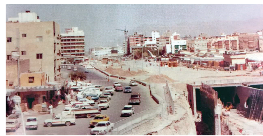
أثناء إنشاء نفق المناخة في الثمانينات الميلادية في عهد خادم الحرمين الشريفين الملك فهد بن عبد العزيز - رحمه الله

•• يظل الحنين للماضي أمراً له جمالياته التي لا تخبو الا لتظهر في أنقى صورة وتعيدك الى زمن أنت عشته بكل ما به من بساطة ومحمية.. بذلك التلاصق العمراني الذي خلق جواً من الاخاء الباهر بين اصحاب تلك البيوت في عملية غاية في البساطة والرفي في التعامل بين بعضهم البعض الأمر الذي افتقدناه الآن حيث لا يعرف الجار اسم جاره للصيق له. إنه زمن غيره من الأزمان اللاحقة.