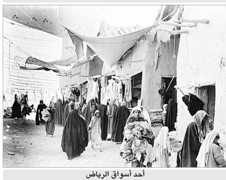
أحد أسواق الرياض