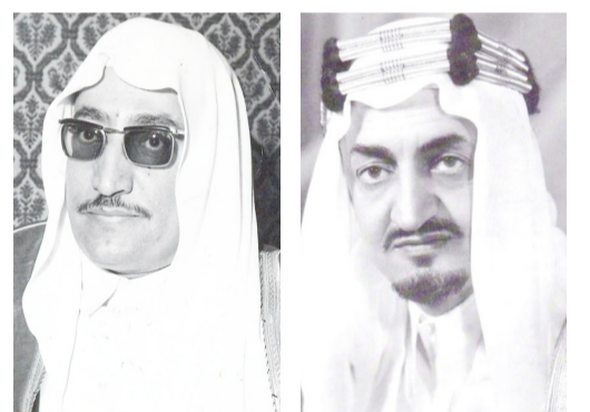
حسن آل الشيخ

ما فتنى معالي وزير المعارف يولي جهوده المشكورة في سبيل تطوير التعليم الصناعي ويوليه من عنايته واهتمامه ما يكفل له اضطراد النجاح ومسيرة التطور الصناعي