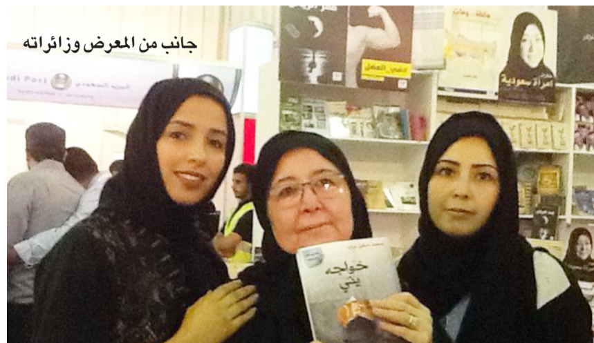
جانبا من المعرض وزائريه

جدة - بخيت آل طالع الزهراني شهد معرض الكتاب في جدة في يومه الثاني حشداً كبيراً من الزوار قدرته بعض المصادر بأنه كان قريبا من ٧٠ ألف زائر، وفي ذات السياق فإن الإقبال على الشراء الكتب لم يكن مرتفعا بحيث راوح معدل البيع ما بين الضعيف والمتوسط وأرجع بعض المراقبين ذلك لعدم وجود الكتب المناسبة او التعريف بهاو لزيادة اسعارها عن المأمول.