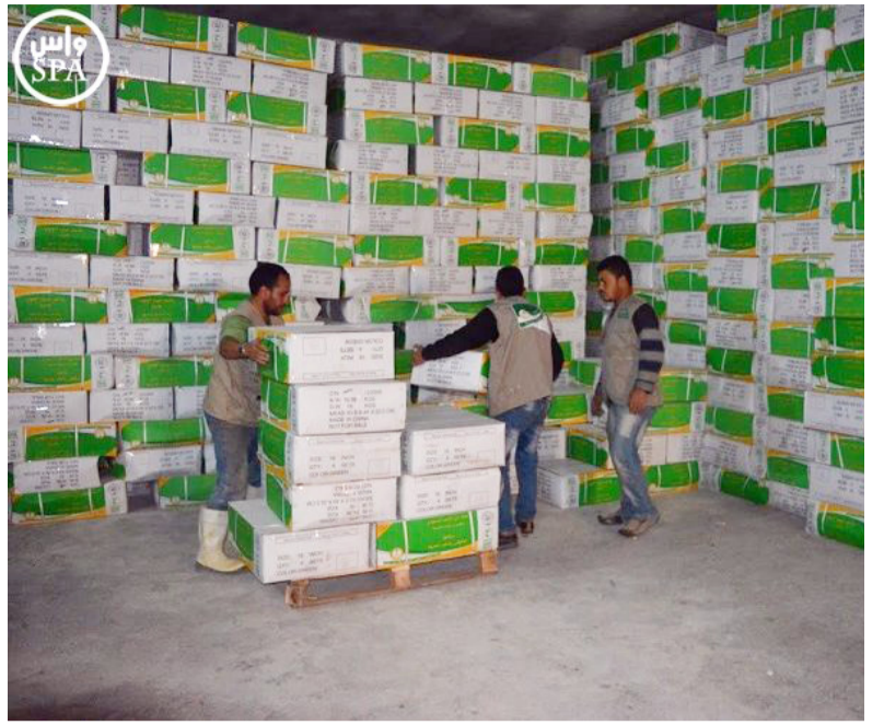
عمان - واس

توقفت تعليمهم الأكاديمي، إضافة إلى النشاطات التربوية الزائدة التي ينفذها المركز السعودي للتعليم والتدريب بإعطاء الدورات التعليمية والحصص الإرشادية في مخيم الزعتري، منوها إلى أن هذا المشروع يعمل على صقل المهارات التربوية لدى الطالب المستفيد واطلاعه على المعارف العلمية في المجالات العديدة خاصة في مجال تقنية المعلومات والكمبيوتر.