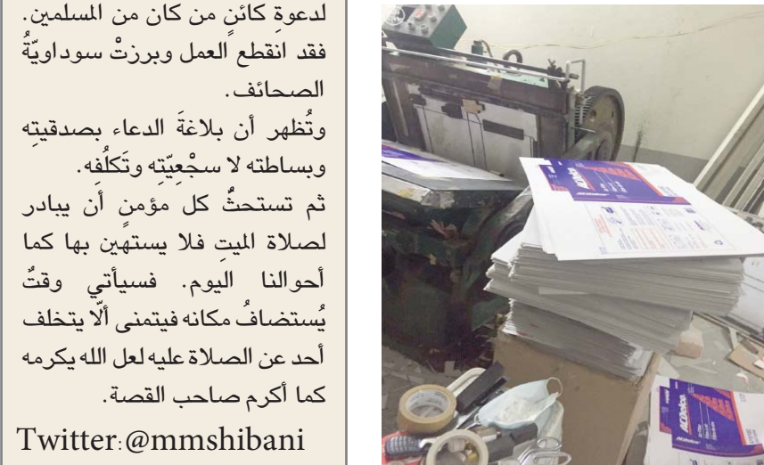
المخازن مملوءة بقطع غيار السيارات المقلدة