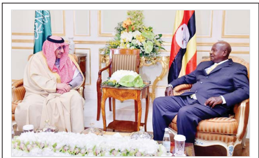
ولي العهد يبحث العلاقات الثنائية مع رئيس أوغندا

جدة - واس أكد معالي وزير العمل الدكتور مفرج بن سعد الحقباني أن مجلس الشؤون الاقتصادية والتنمية الذي يرأسه صاحب السمو الملكي الأمير محمد بن سلمان بن عبدالعزيز آل سعود ولي ولي العهد النائب الثاني لرئيس مجلس الوزراء وزير الدفاع، هو المنصة المركزية لإدارة وتنسيق وتقييم البرامج والخطط التنموية والخدمية التي يتم إعدادها وتطويرها في منظومة سوق العمل. وأضاف معاليه في اللقاء المفتوح مع أعضاء مجلس إدارة الغرفة التجارية الصناعية في جدة ورجال وسيدات الأعمال والمهتمين والإعلاميين الذي أقيم الليلة الماضية في مقر الغرفة بحضور حضور عدد من المسؤولين إن برامج ومبادرات منظومة سوق العمل والتي تتكون من "وزارة العمل، والمؤسسة العامة للتأمينات الاجتماعية، والمؤسسة العامة للتدريب التقني والمهني، وصندوق تنمية الموارد البشرية" هدف، تحظى باهتمام ومتابعة وإشراف مجلس الشؤون الاقتصادية والتنمية، وذلك لتحقيق رضا المواطنين، وتيسير أعمال القطاع الخاص. وأوضح معالي وزير العمل عن خمسة توجهات استراتيجية جديدة تم تطويرها لإدارة سوق العمل تضمنت فرص العمل المستدامة، وتطوير المهارات، العمالة السعودية الوافدة، وسوق العمل الفعال، والحماية الاجتماعية، مشيراً إلى أن التوجهات الاستراتيجية حملت في مضامينها ضرورة تعظيم حصة التوطين من فرص العمل المنتجة والمجزية في القطاع الخاص، وتطوير مهارات القوى الوطنية، فضلاً عن إدارة الاختلالات الهيكلية بين العمالة السعودية الوافدة، وكذلك توفير آليات أساسية لسوق عمل فعال ومزدهر، هذا بخلاف الاعتناء بالعمال وأسرهم من خلال الحماية الاجتماعية.