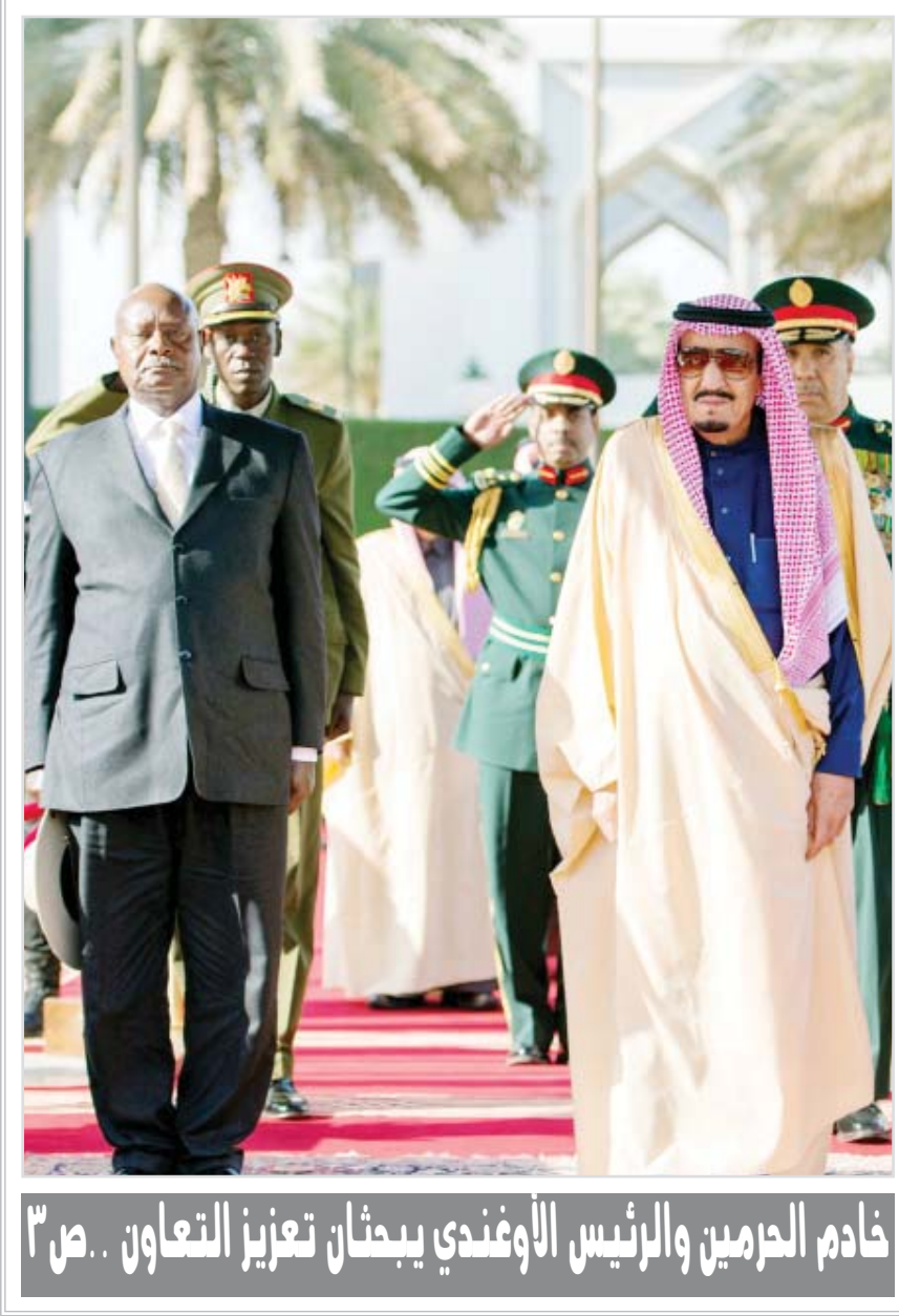
خادم الحرمين والرئيس الأوغندي يبحثان تعزيز التعاون .. ص ٣

جدة - واس أكد معالي وزير العمل الدكتور مفرج بن سعد الحقباني أن مجلس الشؤون الاقتصادية والتنمية الذي يرأسه صاحب السمو الملكي الأمير محمد بن سلمان بن عبدالعزيز آل سعود ولي ولي العهد النائب الثاني لرئيس مجلس الوزراء وزير الدفاع، هو المنصة المركزية لإدارة وتنسيق وتقييم البرامج والخطط التنموية والخدمية التي يتم إعدادها وتطويرها في منظومة سوق العمل. وأضاف معاليه في اللقاء المفتوح مع أعضاء مجلس إدارة الغرفة التجارية الصناعية في جدة ورجال وسيدات الأعمال والمهتمين والإعلاميين الذي أقيم الليلة الماضية في مقر الغرفة بحضور حضور عدد من المسؤولين إن برامج ومبادرات منظومة سوق العمل والتي تتكون من "وزارة العمل، والمؤسسة العامة للتأمينات الاجتماعية، والمؤسسة العامة للتدريب التقني والمهني، وصندوق تنمية الموارد البشرية" هدف، تحظى باهتمام ومتابعة وإشراف مجلس الشؤون الاقتصادية والتنمية، وذلك لتحقيق رضا المواطنين، وتيسير أعمال القطاع الخاص. وأوضح معالي وزير العمل عن خمسة توجهات استراتيجية جديدة تم تطويرها لإدارة سوق العمل تضمنت فرص العمل المستدامة، وتطوير المهارات، العمالة السعودية الوافدة، وسوق العمل الفعال، والحماية الاجتماعية، مشيراً إلى أن التوجهات الاستراتيجية حملت في مضامينها ضرورة تعظيم حصة التوطين من فرص العمل المنتجة والمجزية في القطاع الخاص، وتطوير مهارات القوى الوطنية، فضلاً عن إدارة الاختلالات الهيكلية بين العمالة السعودية الوافدة، وكذلك توفير آليات أساسية لسوق عمل فعال ومزدهر، هذا بخلاف الاعتناء بالعمال وأسرهم من خلال الحماية الاجتماعية.