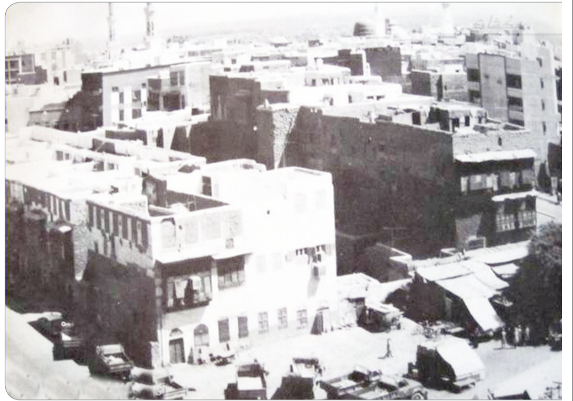
الحي المحيط بالحرم النبوي الشريف ويظهر الحرم