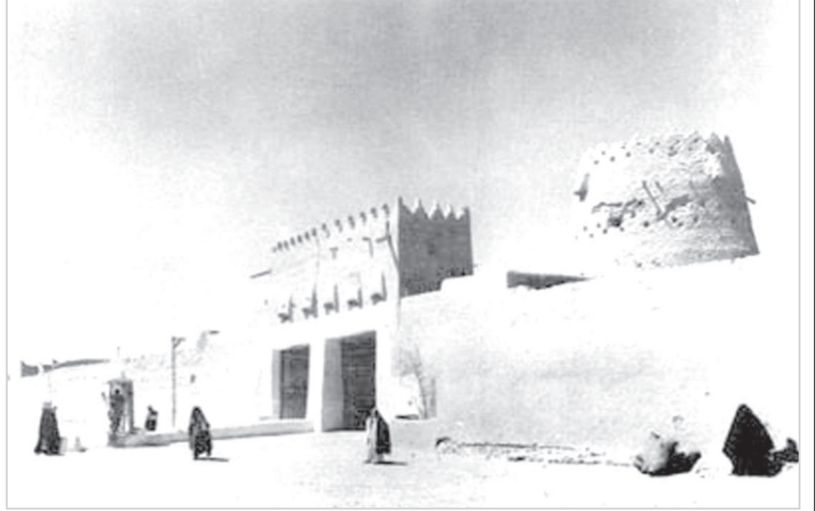
بوابة الثميري بعد توسعتها في عهد الملك عبدالعزيز

هذه المواد نشرت بتاريخ 9 - 2 - 1384 هـ. 20 / 6 / 1964 م