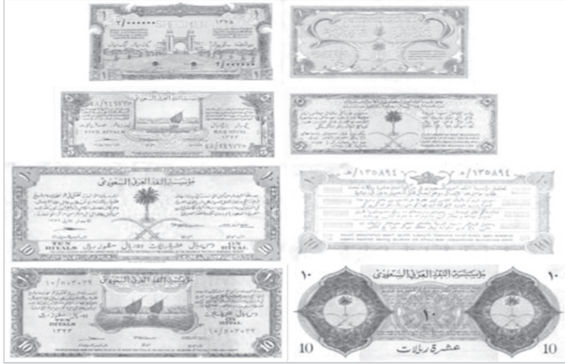
اصدارات نقدية قديمة