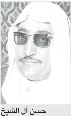
حسن آل الشيخ

الرياض: يقوم معالي الشيخ حسن بن عبداللّه آل الشيخ وزير المعارف بجولات واسعة النطاق على لجان امتحانات العمل في المرحلتين المتوسطة والثانوية للاطمئنان على سير العمل في اللجان المتنوعة ومدى ملاءمة صالات الامتحانات لتأدية الغرض المطلوب منها. وملاحظة التهوية وتأمين الاحتياجات اللازمة لذلك لكي يؤدي الطلبة امتحاناتهم في جو ملائم لا يؤثر على تفكيرهم او اجسامهم. وكان يرافق معاليه في جولاته هذه الاستاذ عبداللّه النعيم مدير التعليم بجدة.