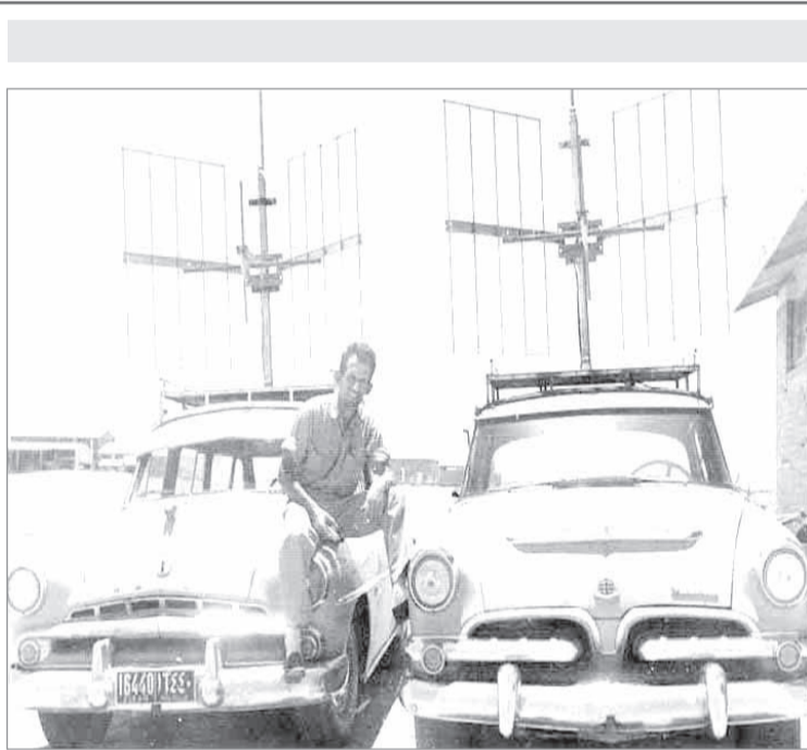
اجهزة ريديو للاتصال برفحاء

اما المهمة التي نوه عنها فهي ان لا تهمل المانيا اصدقاءها القدامى الذين لم تكن لها معهم في يوم من الايام خلافات سياسية لان على العكس كان يجب عليها عندما طلب منها هؤلاء الاصدقاء تعاونها الاقتصادي والفني انه لا تخجل في ان تطلب المساعدة السياسية منهم وربما يكون فقط التأييد المعنوي من هؤلاء الاصدقاء القدامى. وبعد ان انتهت سعادته من خطابه دعى الحاضرين الى مشاهدة فيلم الماني اسمه (ساء بلا نجوم).