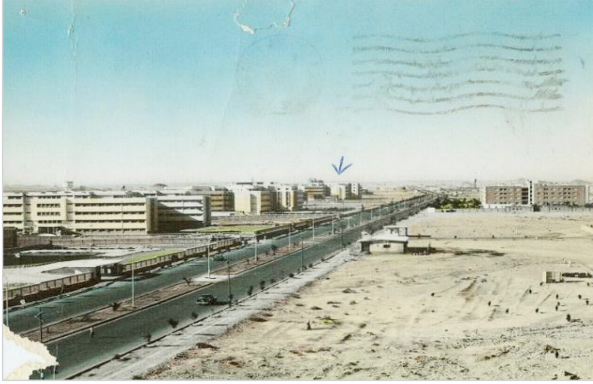
مدينة الرياض .. ( شارع الوزارات من البداية ) ..