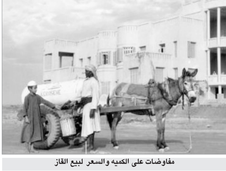
مفاوضات على الكمية والسعر لبيع القاز