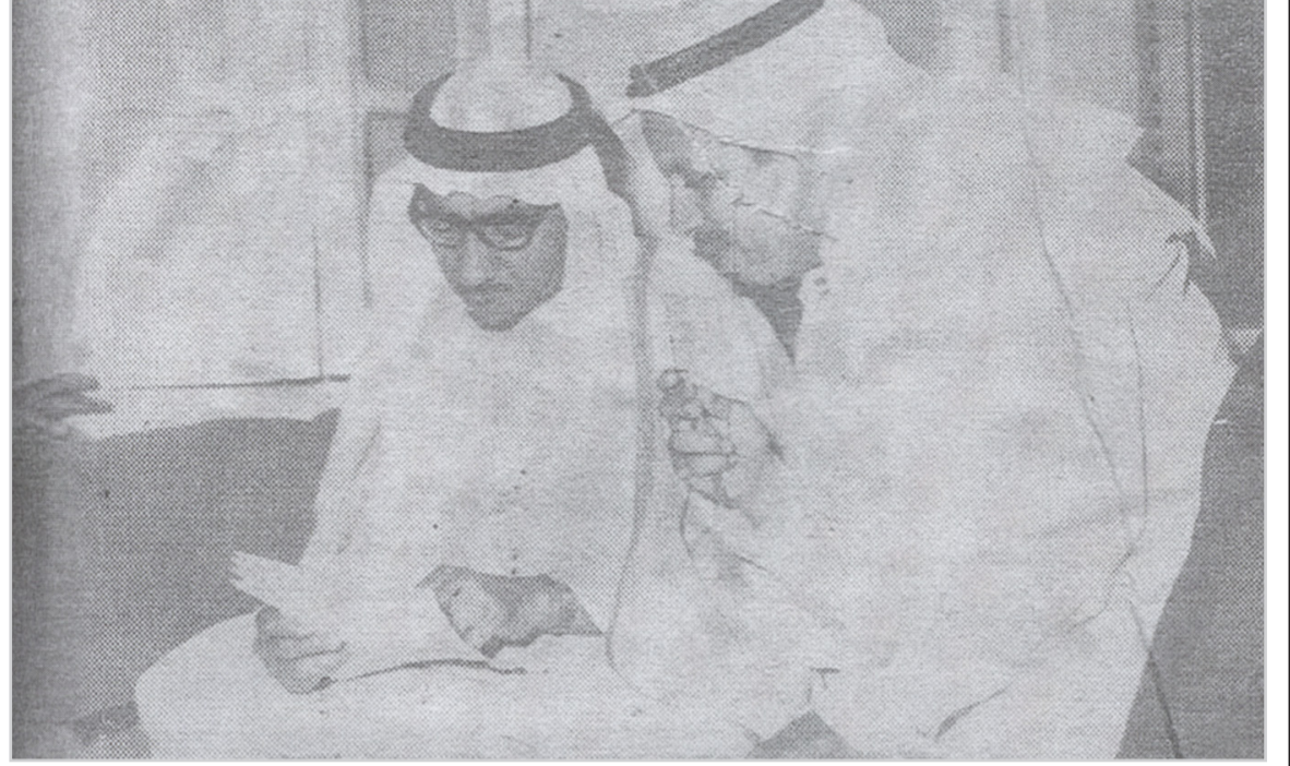
كان يوم امس الموعد المحدد لتسليم الكسوة الشريفة فقد قام معالي الاستاذ محمد عمر بوقس وزير الحج والاقواف بالنيابة بتسليم الثوب الذي صنعه ايد وطنية اخلصت واثارت على العمل حتى صنعت ثوب اقدس بيت على وجه الارض.