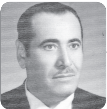
شعر: سعيد فياض

واعلى القمة.. محفوقا بما خصه الله، جنودا امناء حيث ناداك، فلبيت النداء ساعدا ينفتح حبا ووفاء واخا يعضده في وثبه مطئن القلب، لا يخشى عبا XXX