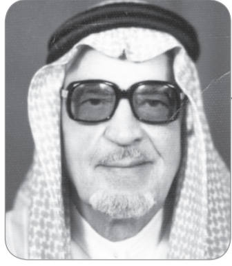
بقلم: علي حسين عامر