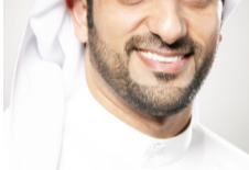
سلطان بن أحمد القاسمي

إن مفهوم التغيير الذي تبته العناية المتفرقة ليس له أي تفسير منطقي. إذ يفسر ذاته بالعنف فقط، وبرفض الواقع مجرد الرفض، فلا تشابه بين واقع نيجيريا وواقع فرنسا على سبيل المثال، لكن التشابه والتطابق يكمن فقط في ثقافة الإرهاب والعنف التي استهدفت هاتين الساحتين. من هنا نستنتج أن مواجهة التطرف لا تتم إلا بمواجهة ثقافته. لقد أنتجت ثقافة الإرهاب والتطرف هوية جديدة تتسم بالانعزال عن محيطها الاجتماعي ومعاداته. نمت وتغذت على ضعف الهوية الوطنية الحقيقية وعلى غياب العناصر المعرفية المكونة لهذه الهوية، فما هي خطة الاتصال الحكومي في مواجهة هوية الإرهاب وتفكيكها وإعادة الاعتبار للإنسان ببويته الطبيعية التي تحدد دوره ومكانته ككائن اجتماعي؟