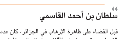
سلطان بن أحمد القاسمي

نفسه أن تتوخى الحذر من الوقوع في فخ عزل هذه الهوية عن بعدها الإنساني. وهذا ممكن فقط إذا اشتملت حملات الاتصال الحكومي على كافة العناصر الثقافية المكونة للهوية، وفي مقدمتها الجهورية للتبادل المعرفي المتكافئ، بين الحضارات والثقافات المختلفة على قاعدة الاعتراف بالتنوع والاختلاف كعامل يثري الهوية ويعزز قيمها الإنسانية.