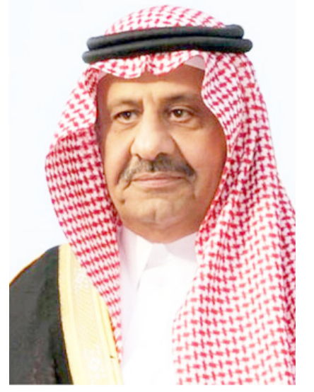
الأمير خالد بن سلطان

وأضاف بيان الجائزة أن هذه الجائزة - التي أسسها صاحب السمو الملكي الأمير سلطان بن عبدالعزيز آل سعود - طيب الله ثراه - وأعلن عن بدء الترشيح لدورتها الأولى في الخامس عشر