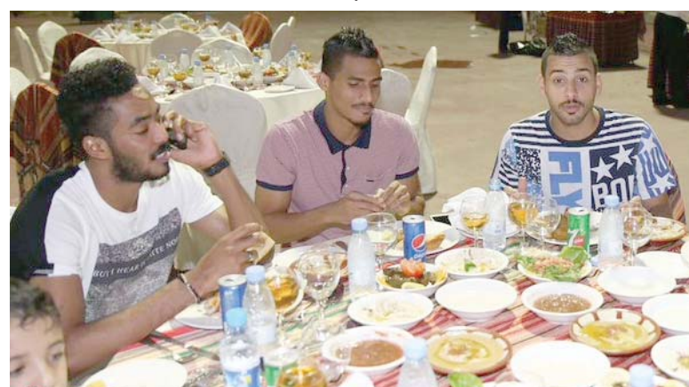
جدة - وليد جاد استهل المدرب السويسري كريستيان جروس مران الأوس بمحاضرة فنية ألقاها على اللاعبين وشرح من خلالها بعض الملاحظات الفنية المراد تنفيذها في مواجهة المقبلة . قبل أن تتحول التحضيرات إلى الميدان من خلال حصة تدريبية طُغت عليها الجوانب الفنية والتكتيكية قبل أن تختتم بمناورة على كامل الملعب . وعقب نهاية المران أقام موسى المياني مدير الكرة بالفريق الأول وليمة عشاء للأجهزة الفنية والإدارة وللاعبي الفريق. هذا وقد شهد المران صاحب السمو الملكي الأمير خالد بن عبدالله بن فيصل بن تركي عضو شرف النادي الأهلي وعبدالله بن بترجي نائب رئيس النادي وعبدالله مؤمنه أمين عام النادي وعبدالله الصبان