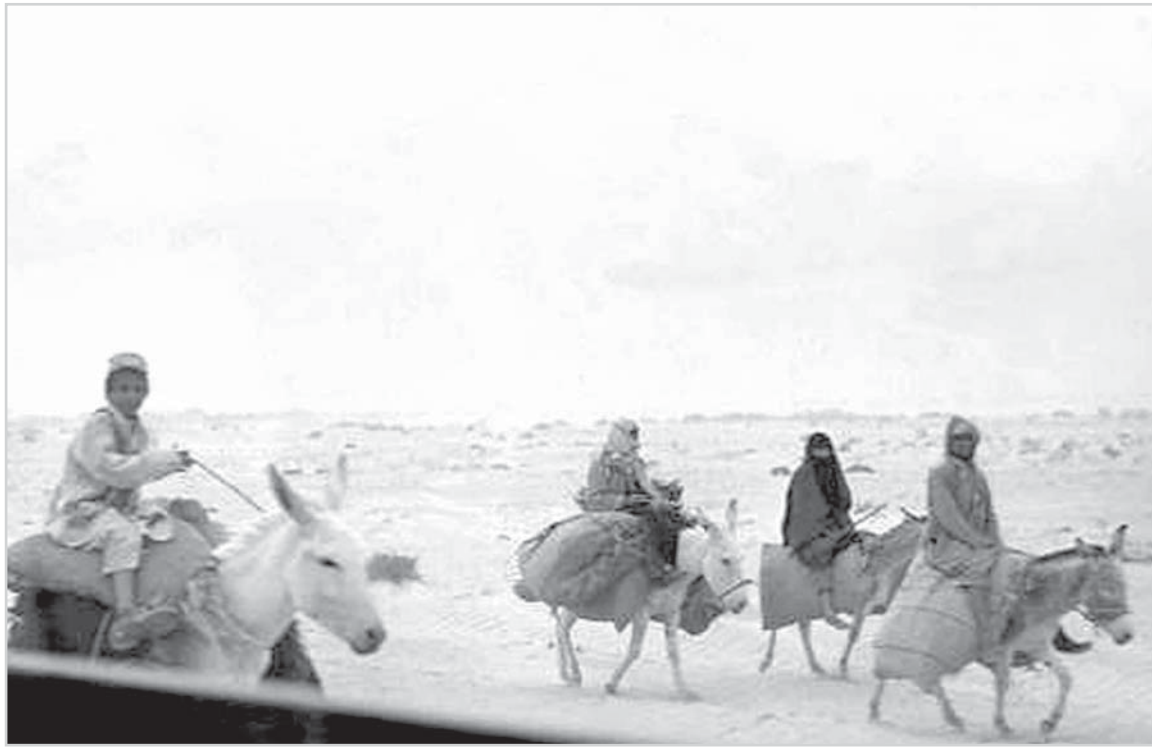
الخرج جنوب الرياض - السبعينات الميلادية