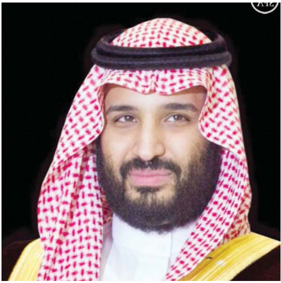
أنطاليا - واس

تلقى صاحب السمو الملكي الأمير محمد بن سلمان بن عبدالعزيز ولي ولي العهد النائب الثاني لرئيس مجلس الوزراء وزير الدفاع، اتصالاً هاتفياً أمس من جلالة الملك عبدالله الثاني بن الحسين ملك المملكة الأردنية الهاشمية. وجرى خلال الاتصال استعراض العلاقات الثنائية الأخوية بين البلدين، وعدد من المسائل ذات الاهتمام المتبادل.