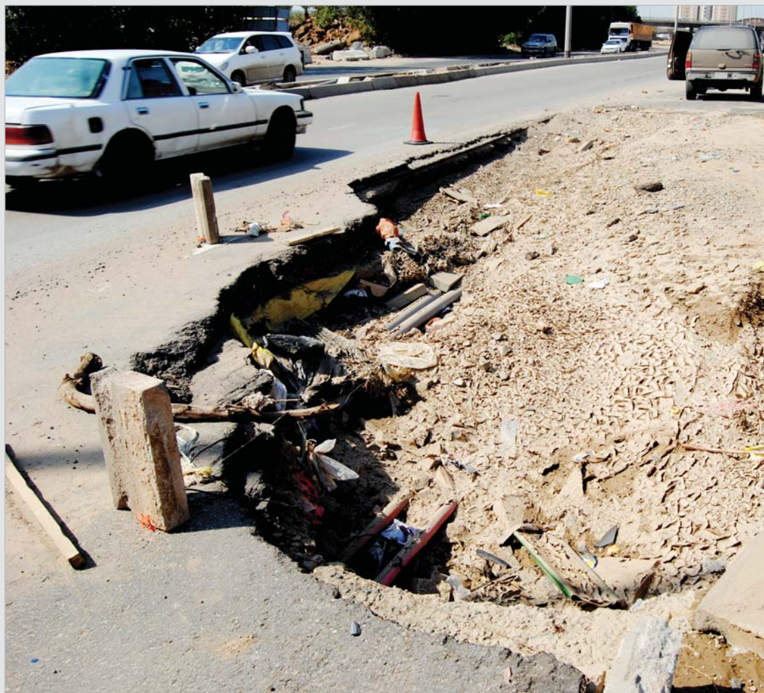
حتى مساء امس مازالت كباري وأضاق في جدة تعيش تداعيات الامطار والاحطار.