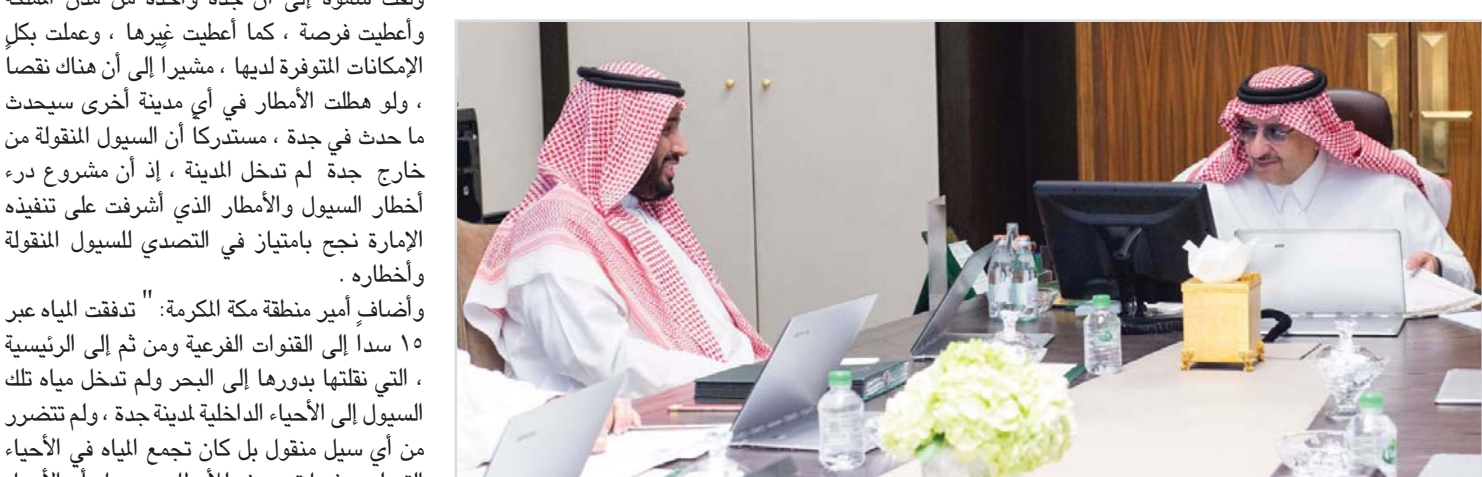
ولي العهد يرأس اجتماع مجلس الشؤون السياسية والأمنية .. ص ٣

جدة- البلاد أكد مستشار خادم الحرمين الشريفين أمير منطقة مكة المكرمة، صاحب السمو الملكي الأمير خالد الفيصل أن تقريرا عن ما حدث في مدينة جدة جراء الأمطار التي شهدتها أمس الأول، سيعرض بشكل مفصل على خادم الحرمين الشريفين الملك سلمان بن عبدالعزيز، يحفظه الله، فور الانتهاء منه. وقال الأمير خالد الفيصل: "أود أن أقول نحن جميعنا نقدي بخادم الحرمين الشريفين الملك سلمان بن عبدالعزيز الذي قالها علنا، أنه يقبل النقد البناء من الجميع، وشكر كل من يقدم له نصيحة، وقال أيضا أن مجالسنا ومكاتبنا وأبوابنا مفتوحة للجميع فشكرا لكل من انتقد بشكل بناء، وأعاننا على تصحيح الأخطاء، فالمسؤول بلا تذكير لا يستطيع إنجاز عمله، وقد أمرنا الله بالتشاور وأخذ النصيحة والتذكير، وليس بالتشهير أو التهجم على شخص أو إدارة، بل بمساعدتها على النهوض بأعمالها على السبيل الأمثل"، مضيفا "شكر لكل من ساعدنا على تصحيح أوضاعنا، وغفا الله عن من تجاوز وتهمج وأساء".