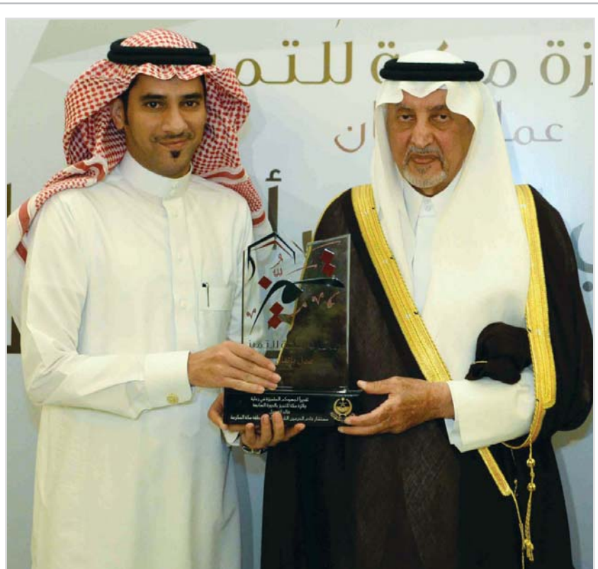
خالد الفيصل يرعى حفل جائزة مكة للتميز .. ص ٩