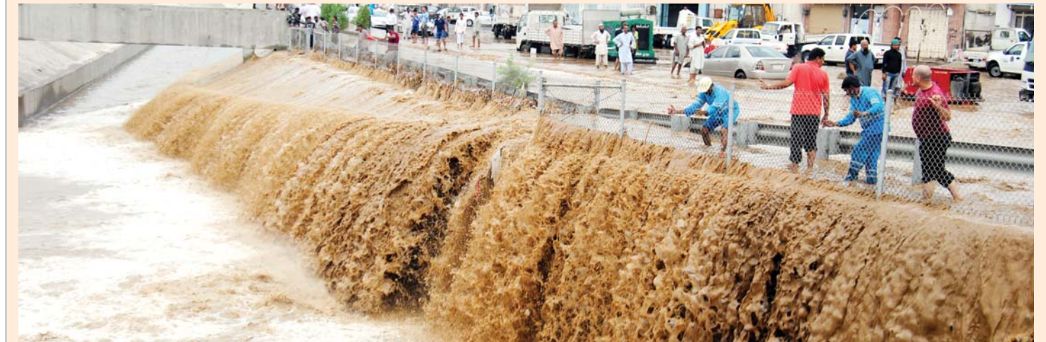
اتهامات متبادلة بين الأمانة والكهرباء في سيول جدة .. ص ٨

الرياض - واس أكدت لجنة النقل بغرفة الرياض التجارية والصناعة أن اللجنة تلقت ردا رسميا من جهة الاختصاص المعنية بالرقابة على شركات التأمين، يؤكد أن الوثيقة الموحدة للتأمين الإلزامي على المركبات نصت على أنه "في حالة حدوث ضرر مغطى بموجب هذه الوثيقة سواء كان ناشئا عن استعمال المركبة أو توقفها داخل أراضي المملكة بتعويض الغير نقدا في حدود الأحكام والشروط الواردة في الوثيقة".