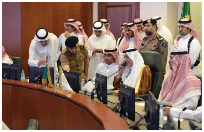
خالد الفيصل يتابع الخدمات اثناء هطول الامطار