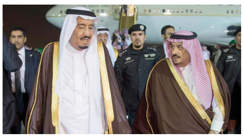
خادم الحرمين الشريفين يصل إلى الرياض