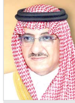
محمد بن نايف

بمنطقة الرياض والتي استهدفت الجمهور بجميع فئاته كما تضمنت مفاهيم هذه الحملة أهمية تعزيز قيم النزاهة ومكافحة الفساد وامتدت برامج الحملة حتى شملت جميع المحافظات التابعة لإمارة منطقة الرياض واشتت جدواها في تعزيز قيم الانتماء الوطني. وقد طلبت الهيئة مخاطبة الجهات الحكومية على مستوى المنطقة للاشتراك مع الغرف التجارية لحضور اللقاء التعريفي الخاص بشرح فكرة هذه المبادرة للمسؤولين لتبنيها بالاشتراك مع جمعية الكشافة وعقد شراكة بين الجمعية والهيئة ومن ضمن هذه المشاركات الفاعلة (شارة نزاهة) اصداقاً نزاهة وتفعيل دور اندية الهيئة والنشاط الكشافي بإدارة التعليم بالمنطقة والجامعات ومن ضمن مخرجات المبادرة فقد قامت ادارة الطرق والنقل بمنطقة الرياض بوضع اللوحات التعريفية والارشادية للمبادرة بالشوارع والجسور على الرق السريعة كما تم ايضاح دور امانة الرياض بوضع لوحات على الشاشات الالكترونية بالشوارع والطرق داخل مدينة الرياض بالإضافة إلى تعميم المبادرة على الجهات الحكومية لوضع لوحات ارشادية وتعليمية في بيو الادارات على مستوى المنطقة بالإضافة الى تفعيل الدور الاعلامي للمبادرة واقامة الندوات والمحاضرات العلمية لدعم هذا التوجه.