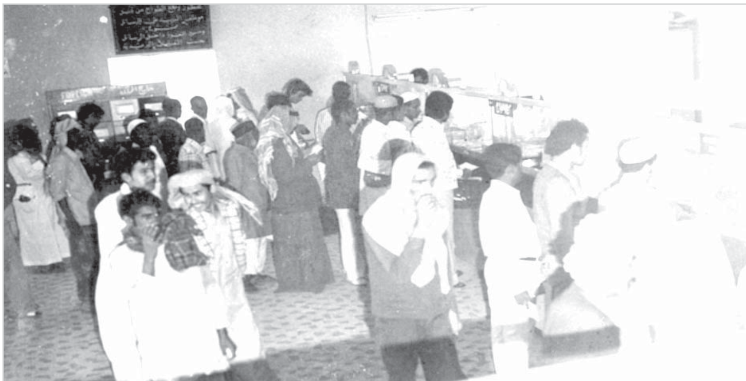
البريد السعودي قديماً