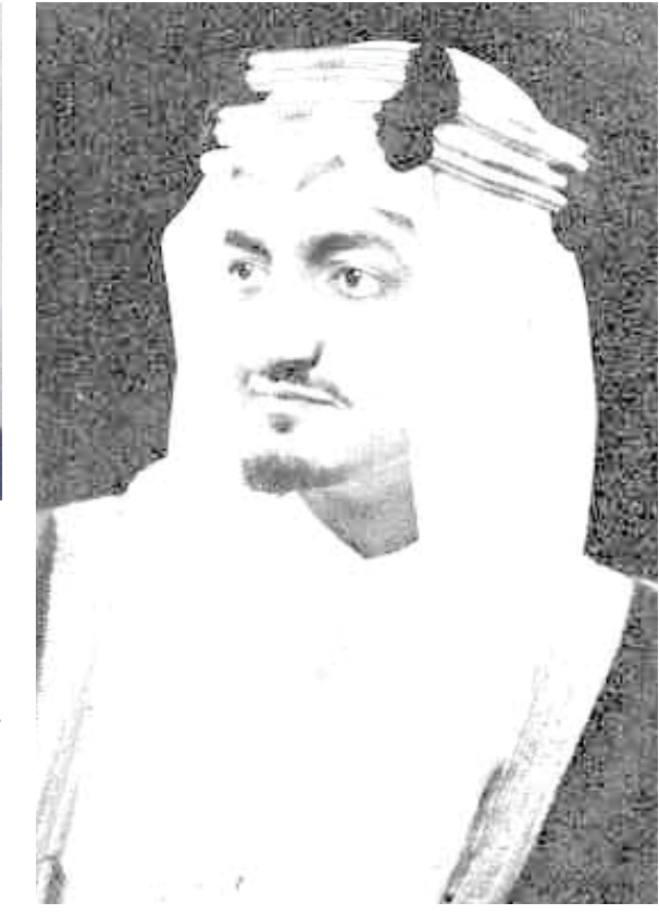
المدينة المنورة - من بعثة "البلاد"

الشريف وكانت جموع غفيرة من مختلف انشاء الشعب على جانبي الطريق المؤدية إليه. فما ان كان يمر بها حتى كانت تعلن عن فرحتها به في هتاف مدو بحياة الملك الامام.