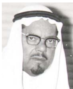
عبد الله عريف

علم محرر البلاد بمكة المكرمة ان المجلس الاداري بامانة العاصمة قد عقد ليلة امس الاول اجتماعا هاما برئاسة سعادة الاستاذ عبداللّه عريف أمين العاصمة وبحضور كبار المسؤولين في الامانة ورؤساء الشعب المختصة. وقد بحث المجلس خلال اجتماعه الاستعدادات التي ستبدأ الامانة في اتخاذها خلال ايام الحج بالنسبة للمشاعر المقدسة وكذلك بالنسبة لايام (الخليف) في مكة المكرمة.