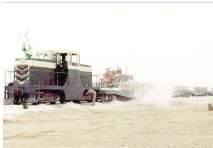
المرحة الأولى لانشاء السكة حديد الاربيعينات