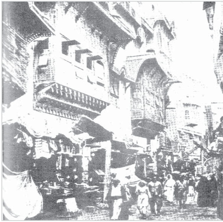
شارع المدينة الرئيسي يصل بين المسجد النبوي وقبر الرسول صلى الله عليه وسلم