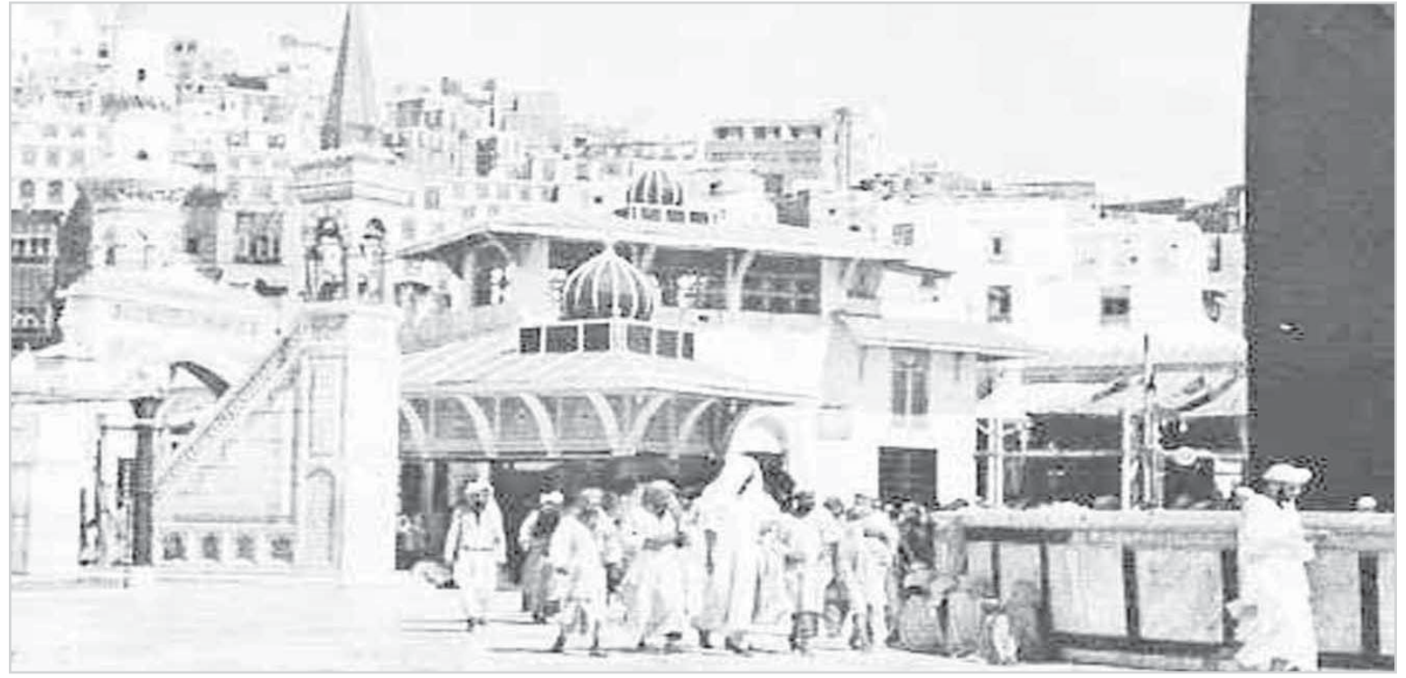
صورة قديمة للحرم المكي الشريف

هذه المواد نشرت بتاريخ 1-11-1384 هـ. 4/3/1965 م