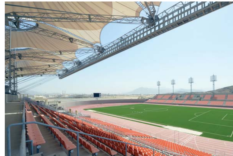
ملعب جامعة أم القرى

مرافق المدينة الجامعية - وبسؤال معالي الدكتور بكري عن مدى استكمال كليات ومباني ومرافق المدينة الجامعية لجامعة أم القرى بالعابدية؟ أجاب بقوله: تم من الله بفضلته ثم بدعم من حكومتنا الرشيدة حفظها الله من الانتهاء من العديد من الكليات والمرافق التابعة لها كالتفصيل الدراسي المستجدة والعمل جار حالياً في استكمال بقية المشروعات في هذه المدينة الجامعية.