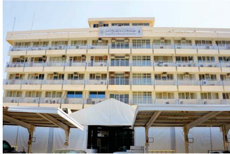
معهد خادم الحرمين لأبحاث الحج والعمرة

مرافق المدينة الجامعية - وبسؤال معالي الدكتور بكري عن مدى استكمال كليات ومباني ومرافق المدينة الجامعية لجامعة أم القرى بالعابدية؟ أجاب بقوله: تم من الله بفضلته ثم بدعم من حكومتنا الرشيدة حفظها الله من الانتهاء من العديد من الكليات والمرافق التابعة لها كالتفصيل الدراسي المستجدة والعمل جار حالياً في استكمال بقية المشروعات في هذه المدينة الجامعية.