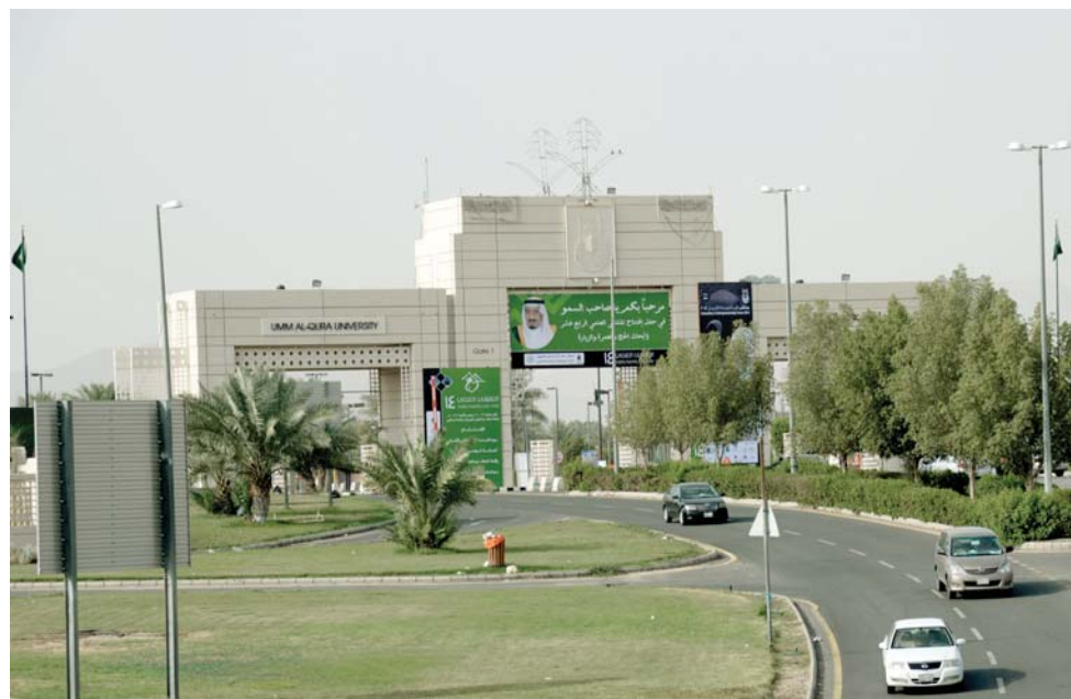
بوابات جامعة ام القرى بمقر العابديه