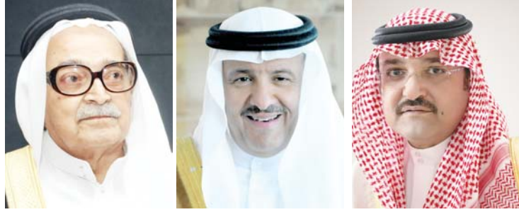
الأمير مشعل بن ماجد الأمير سلطان بن سلمان صالح كامل

الأحوال العادية بـ ٢ ريلات يباع في مهرجان جدة السياحي بـ ١٥ ريلات أو سبعة) وهذا مثال واحد أضعه أمام شاهيندر تجار جدة الشيخ صالح عبدالله كامل ورئيس غرفة الرياض الدكتور حمد الزامل وروؤساء الغرف التجارية وأمانتها العاملين لماذا لا تكون هناك (شركات متخصصة للسياحة الداخلية) تقوم بإعداد برامج سياحية داخلية للمواطنين السعوديين (في مصر) والسؤال المطروح هل نجحت برامج السياحة الداخلية في استقطاب العائلات معي على نفس الرحلة بعد قضاء إجازة العيد (في مصر) والسؤال المطروح هل نجحت برامج السياحة الداخلية في استقطاب العائلات السعودية لقضاء هذه الإجازة القصيرة داخل الوطن؟.. والجواب الحقيقي (لا) حيث تفضل بعض الأسر السفر إلى الأماكن القريبة من المملكة: مصر- الأردن وتركيا - والسبب أنها تصرف في هذه البلدان أقل ما تتطلبه (السياحة الداخلية) من مصروفات. من سنوات عديدة أتابع جهود صاحب السمو الملكي الأمير سلطان بن سلمان رئيس هيئة السياحة والتراث الوطني في المملكة الذي يحاول تذليل كافة الصعوبات التي تعترض تأشيرات سياحية تتيح للضيف الزائر التنقل في جدة والرياض والدمام والطائف وباقي مدن المملكة وقضاء وقت سياحي متميز في بعض المناطق السياحية الساحرة سواء في الطائف أو الباحة أو جدة أو الدمام أو حائل وينبع وكل مناطق المملكة التي بها مناطق جذب سياحي وأهمها (منطقة عسير) ولكن ما يصدم هذه الحقيقة هو أسعار السياحة الداخلية والتي يفاجأ المواطن السعودي أو الفقيه بالمملكة أنها (فوق الأرقام المتعارف عليها) وخذ على سبيل المثال (طبق البطاطس القليلة الذي يباع في