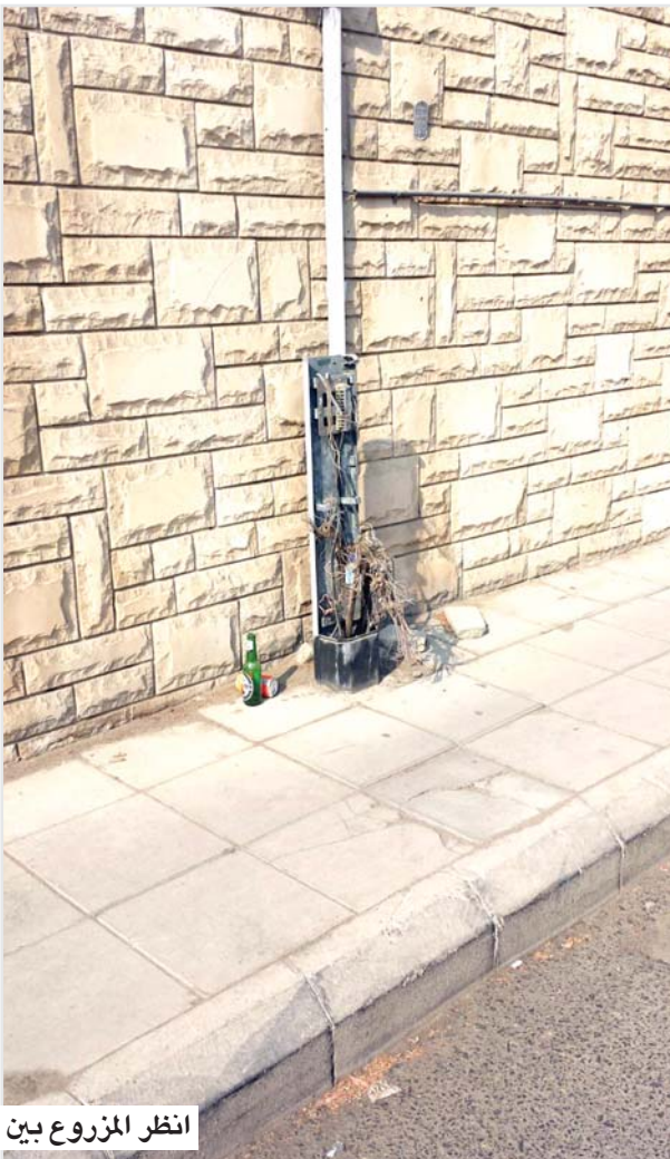
انظر المزروع بين اسلاك تليفون