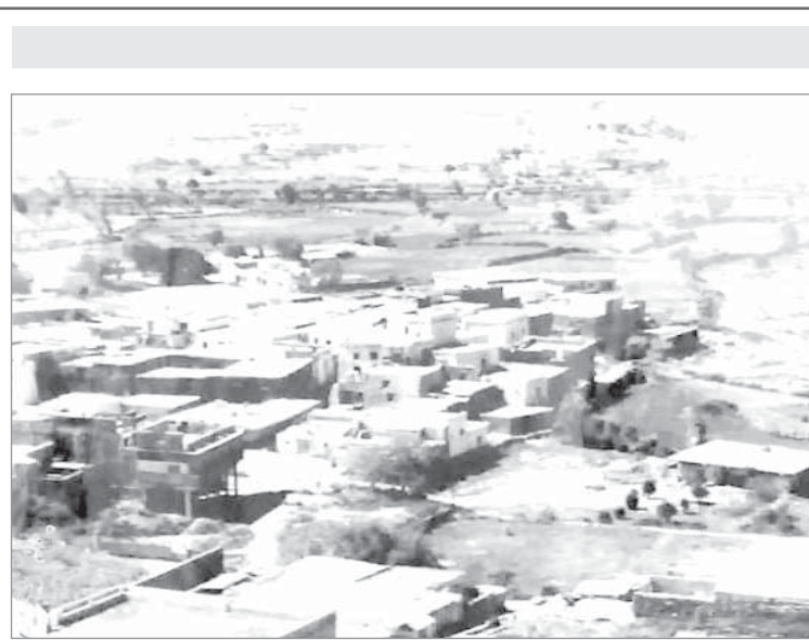
صورة قديمة للباحة

المعارف لقيت اهتماما كبيرا من الجانب الفرنسي للمبادرة بالعمل السريع على إنجازها. وأضاف المطبقاني بأن الجانب الفرنسي وعد بقبول ثلاثين طالبا من خريجي المدارس الصناعية للعام القادم على ان تتحمل الحكومة الفرنسية نفقات تكاليف دراستهم الفنية.. كما وعد ايضا بإرسال ثلاثة مدرسين لتعليم اللغة الفرنسية في بعض المدارس الثانوية السعودية..