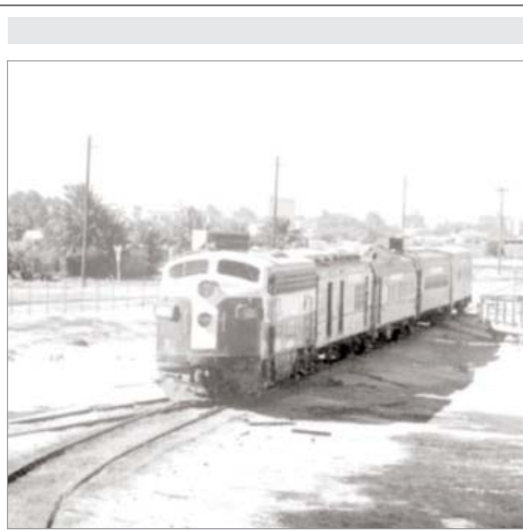
القطار - بداية السبعينات

ولقد أبدى معالي الوزير الكثير من التفهم لمثل هذه المواضيع كما أبدى استعداداه للعمل على دعمها وتحقيقتها لمنفعة الصالح العام.. وقد وعد معاليه ايضا بحل كثير من الصعوبات التي تواجه القطاع الخاص بتعقيب معاليه الشخصي على الجهات المسؤولة والمسؤولين.