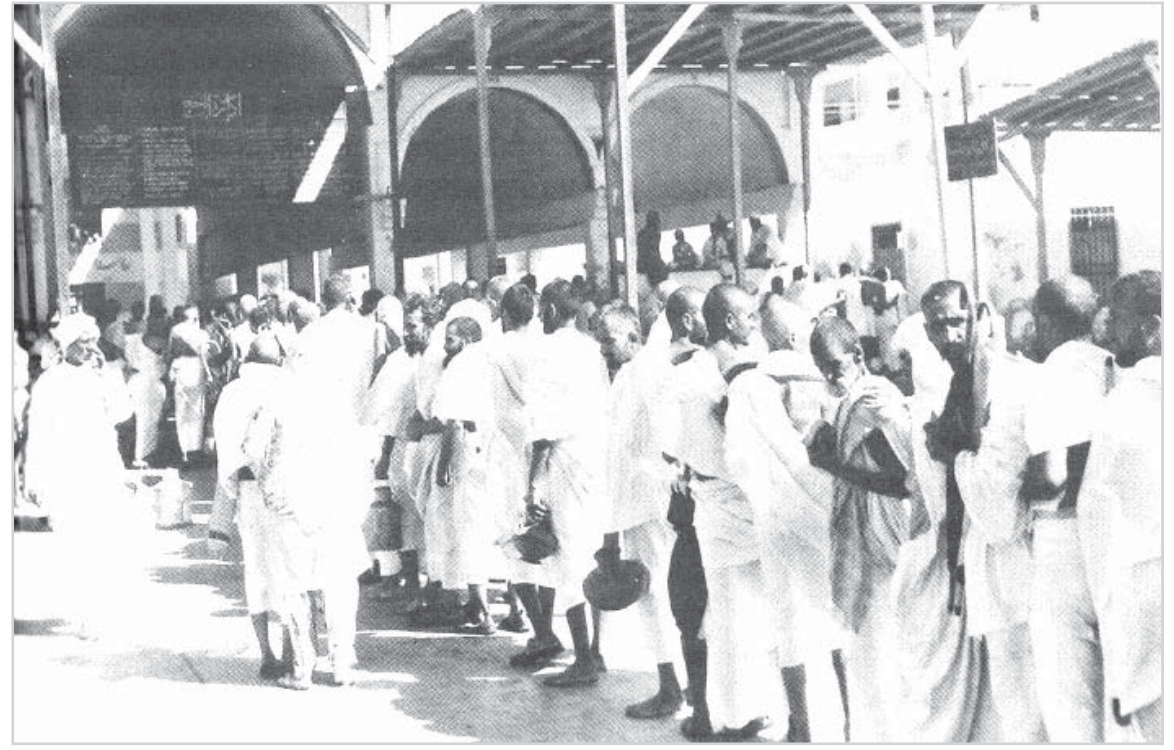
الحجاج في المحجر الصحي

هذه المواد نشرت بتاريخ 24 - 10 - 1384 هـ 26 / 2 / 1965 م