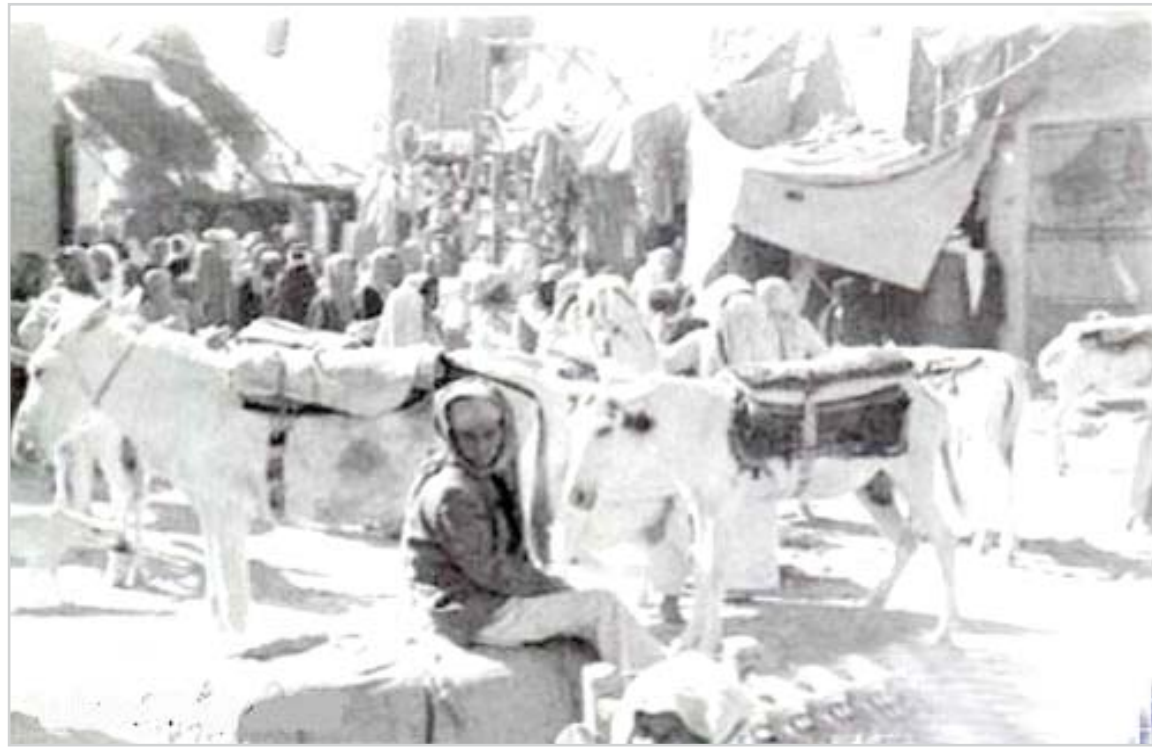
المقبرة - الرياض القديمة