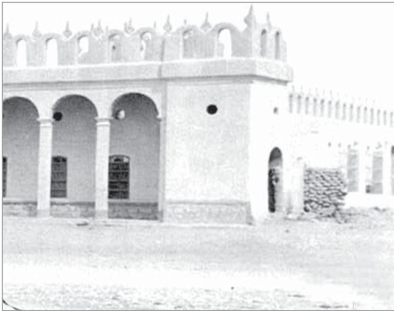
المدرسة الأهلية - الرياض