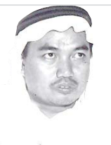
بقلم: عبدالغني قسبي

هذه المواد نشرت بتاريخ 23-10-1384 هـ. الخميس 2-25-1965 م