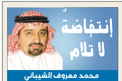
محمد معروف الشيباني

الدمام-حمود الزهراني يرعى أمير المنطقة الشرقية صاحب السمو الملكي الامير سعود بن نايف بن عبدالعزيز اليوم الأحد انطلاقاً لفعاليات معرض وظائف ٢٠١٥ الذي تنظمه غرفة الشرقية بالشراكة مع شركة الظهران اكسبو ويستمر حتى الاربعا ١٤ أكتوبر الذي خصص للعائلات، حيث يحتضن المعرض مركز الشركة الواقع على طريق الدمام