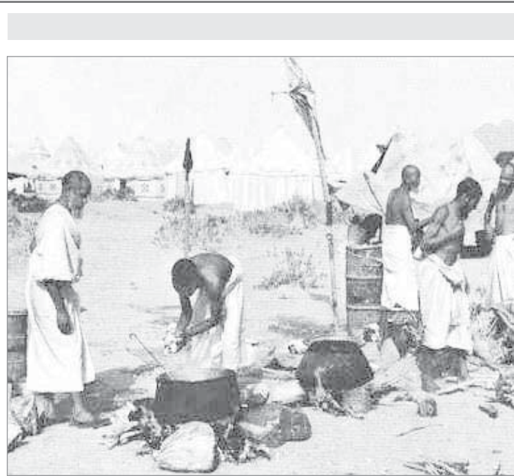
الحج - ١٩٥٨م