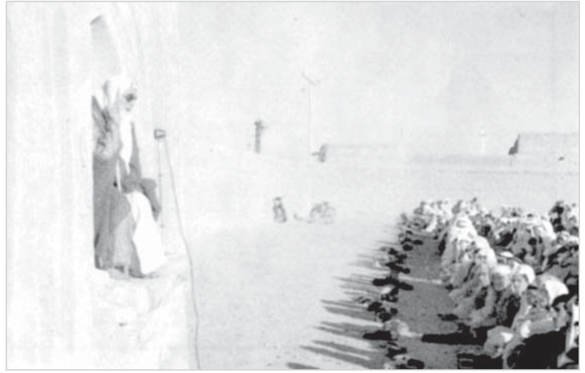
صلاة العيد في الرياض ١٣٥١هـ

هذه المواد نشرت بتاريخ 16 - 7 - 1384هـ 21 / 11 / 1964م