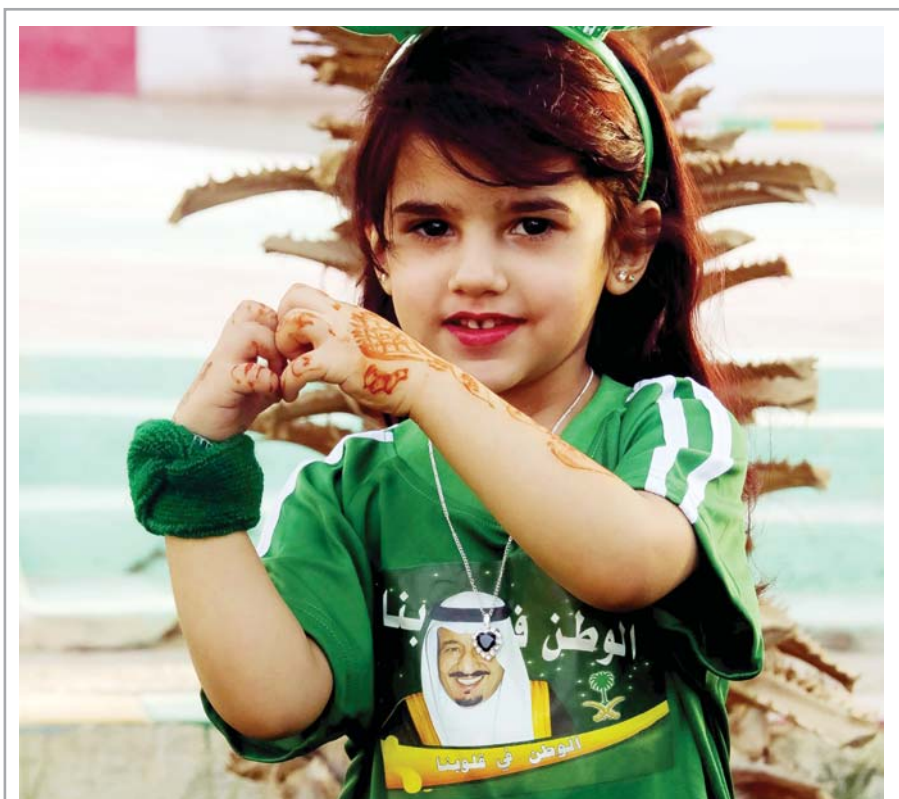
وطن الحزم والعزم في قلوب البراعم .. ص ٢

وتقوم على "المشروع الوطني للتعرف على الموهوبين" مؤسسة الملك عبدالعزيز ورجاله للموهبة والإبداع "موهبة" بالتعاون مع وزارة التعليم والمركز الوطني للقياس والتقويم في التعليم العالي "قياس"، ويدخل المشروع عامه السادس من مسيرته بالكشف عن المواهب الوطنية في كافة الإدارات التعليمية.