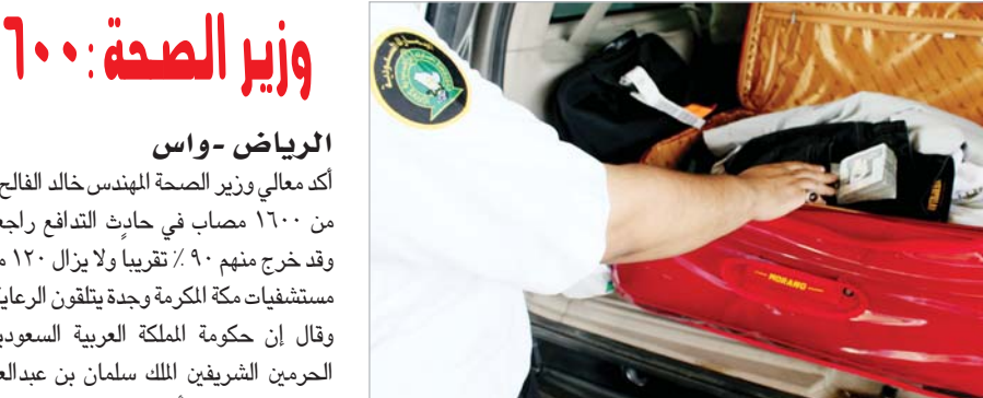
محاولة تعريب ٢٣٠ ألف ريال