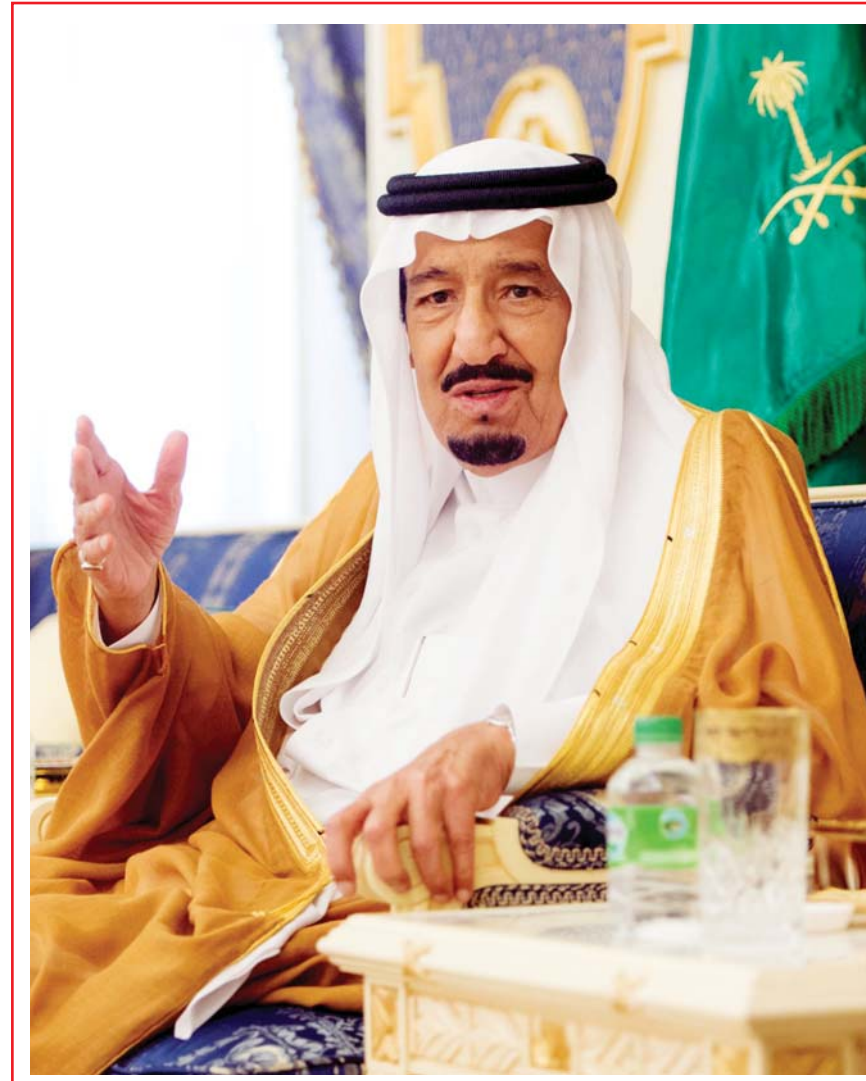
خادم الحرمين يستقبل الأمراء والعلماء والمواطنين .. ص ٣