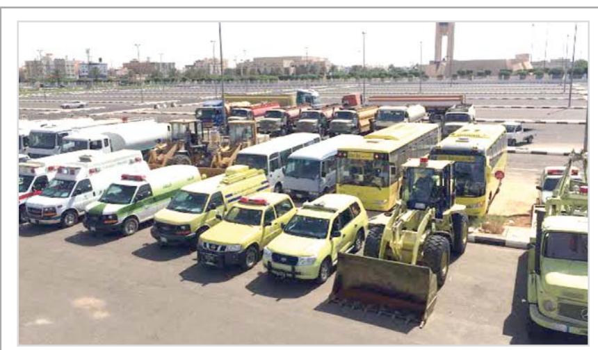
مدني تبوك يواجه اخطار الامطار والسيول

استقبل خادم الحرمين الشريفين الملك سلمان بن عبدالعزيز آل سعود . حفظة الله . في الديوان الملكي بقصر السلام أمس فخامة الرئيس عبدربه منصور هادي رئيس الجمهورية اليمنية الشقيقة والوفد المرافق له. وفي بداية الاستقبال هنا خادم الحرمين الشريفين، فخامته بعودته وحكومته الشرعية لمدينة عدن العاصمة المؤقتة لليمن ومزاولة مهامهم، داعياً الله أن يحقق لليمن وشعبه الشقيق الأمن والاستقرار. كما جدد خادم الحرمين الشريفين - أيده الله - التأكيد على دعم المملكة الكامل للجمهورية اليمنية وحكومتها الشرعية، وحرصها الدائم على أمن واستقرار اليمن ومساعدة شعبه الشقيق. من جانبه، أعرب فخامة الرئيس اليمني عن بالغ شكره وتقديره لخادم الحرمين الشريفين، وإخوانه قادة دول التحالف، على وقوفهم الدائم إلى جانب الشعب اليمني وحكومته الشرعية، وتقديم كل أشكال العون والمساندة بما يحقق لليمن الأمن والاستقرار. بعد ذلك جرى خلال الاستقبال بحث مستجدات الأوضاع على الساحة اليمنية.