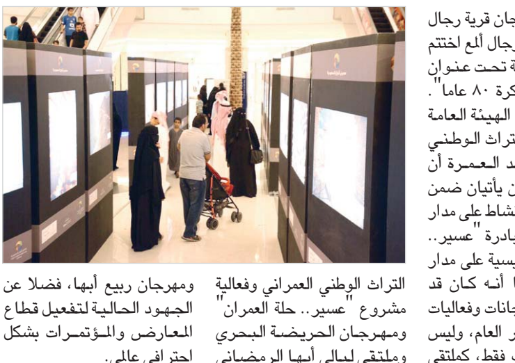
في حين كان مهرجان قرية رجال