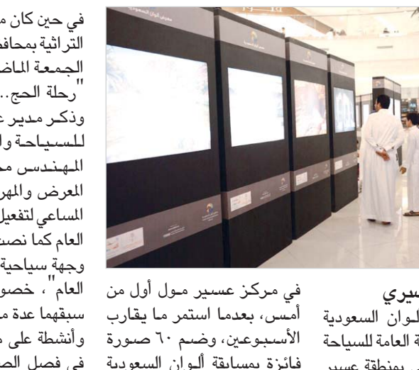
في مركز عسير مول أول من