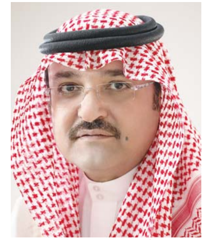
الأمير مشعل بن ماجد

ميرزاً سموه الأهداف التي سيركز عليها المعرض وفي مقدمتها نشر الوعي والمعرفة وتثقيف المجتمع بما ينمي معارفهم ويشجعهم على المزيد من القراءة والاحتراف بالكتاب والمهتمين به لإثراء الحركة الفكرية والمعرفية والاهتمام بالأدب والمتفكرين وكل شرائح المجتمع وربطهم بثقافة الكتاب. ونوه بأن نجاح المعرض مرهون بتكاتف مجهودات الجهات الحكومية والخاصة، لأن إثراء للحركة الفكرية والأدبية رسالة يشترك فيها الجميع، مؤكداً مواصلة فريق العمل مهامها والتزاماتها تجاه إخراج الحدث بالصورة التي ترقى للطلعات والأمال بما يتواءم مباشرة من محافظة جدة، مؤكداً بأن ثقافة الكتاب جزء من نسيج المجتمع السعودي وسيكون لهذا المعرض مكانة مرموقة بهويته التي تتلاءم مع إرث وتاريخ جدة عبر استثمار الكثافة الجماهيرية المتوقعة في زيارات المعرض من قبل شرائح المجتمع المختلفة.