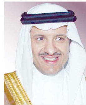
سلطان بن سلمان

جستك GISTECH (GISWORX) بالامارات العربية المتحدة في ابريل ٢٠١٤م، وجائزة الإجاز الخاص في نظم المعلومات الجغرافية. من إيزري (User) - ESRI Conference) بالولايات المتحدة الأمريكية في يوليو ٢٠١٤م، كما تم تصنيف تطبيقات الهيئة في مجال نظم المعلومات الجغرافية ضمن التطبيقات الرائدة عالميا في مجلة (Geospatial World) بعدد مراتب الأبحاث السياحية "ماس" وتناول التقرير مهام مركز المعلومات والأبحاث السياحية "ماس" الذي تم إنشاؤه في عام ٢٠٠٢م وما حققه من إنجازات من خلال اضطلاعها بجمع المعلومات وإدارة وتحليل البيانات والإحصاءات السياحية، وقيام المركز بإعداد البحوث والدراسات السياحية المتميزة ونشرها وتقديمها للشركاء، الأمر الذي يسهم في عملية تطوير السياحة المستدامة في المملكة، لافتا إلى أن مركز "ماس" على قدمه من إنجازات يجسد تطورات الهيئة في التأسيس لمنهج علمي مدروس للنهوض بالسياحة وتنميتها، مما يجعل من قطاع السياحة بالمملكة رافدا مهما لدعم الاقتصاد الوطني وتعزيز التنمية المتوازنة في مناطق المملكة.