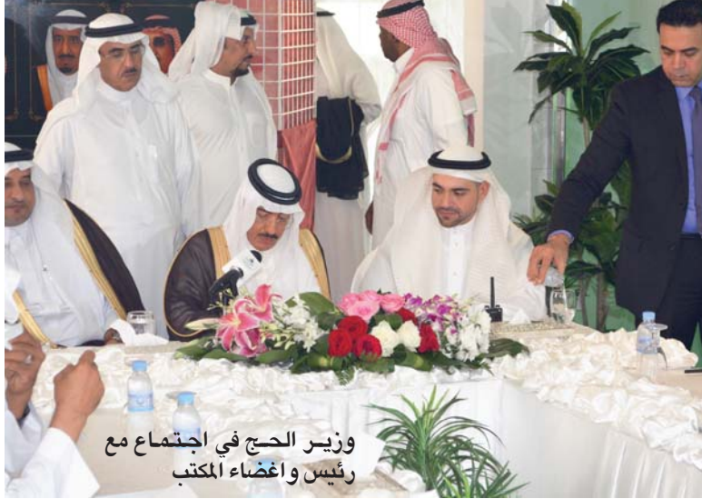
وزير الحج في اجتماع مع رئيس وأعضاء المكتب

الجدير بالذكر أن مهنة السقاية والرفادة قد بدأت منذ عهد المطلب بن هاشم جد النبي صلى الله عليه وسلم وورث هذه المهنة لخدمة حجاج بيت الله الحرام حياً بعد جيل إلى أن انفصلت السقاية عن الرفادة فأصبحت طائفة الزمامة والرفادة طائفة المطوفين وسمرت بهذه المهنة عدة عصور كان آخرها العهد السعودي الزاهر حيث كان الزمامة والمطوفين يعملون بالتقارير وهي عبارة عن وثائق من حاكم المنطقة تخص كل عائلة من عوائل الزمامة بخدمة حجاج بلد معين أو جهة معينة حتى عهد جلالة الملك فيصل رحمه الله حيث أنه في عام ١٢٨٤هـ ورغب جلالة في تحسين أداء أرباب الطوائف فأصدر جلالته نظام المطوفين العام وتم تطبيقه على الزمامة والمطوفين وقد أعتد النظام على فتح باب المنافسة بين أرباب الطوائف وذلك بفتح باب السؤال للحجاج وقد استمر العمل بهذا النظام إلى أن تم إنشاء مؤسسات أرباب الطوائف ومن ضمنها مكتب الزمامة الموحد الذي أنشئ عام ١٤٠٣هـ بقرار من معالي وزير الحج والأوقاف السابق الأستاذ عبد الوهاب أحمد عبد الواسع - رحمه الله - وقد شمل هذا القرار وما تبعه من لوائح إعادة هيكلة مكتب الزمامة الموحد بحيث أصبح عمل الزمامة عملاً جماعياً بدلاً من عملاً فردياً وهذا العمل الجماعي في إطار مؤسسي تحكّمه لوائح وأنظمة مالية وإدارية أعدت واعتمدت من قبل معالي وزير الحج الذي يشرف إشرافاً مباشراً وديقاً على تنفيذ هذه الأنظمة واللوائح ومتابعتها .