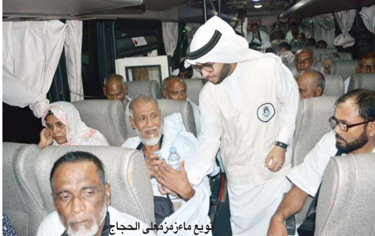
توزيع ماء زمزم على الحجاج