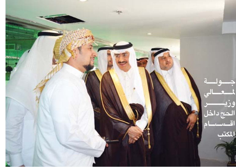
جولة معالي وزير الحج داخل أقسام المكتب

العمليات والذي يهدف إلى ربط مختلف الجهات ذات العلاقة عبر حلقة وصل متكاملة لأجهزة الاتصال المختلفة . أما عن البرنامج السابع فهو برنامج المتابعة والمراقبة الذاتية لمراقبة ومتابعة الخدمات التي يقدمها المكتب لضيوف الرحمن . والبرنامج الثامن هو برنامج العلاقات العامة الحكومية والذي هو تمثيل المكتب في المشاركات والمناسبات الرسمية .