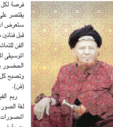
جدة - البلاد

الاسلامي القديم بكل ما يحتويه من اشكال هندسية واللوان مركبة وهي من ابداع ما ابتكر في الحضارة الانسانية.