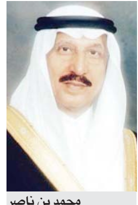
محمد بن ناصر

هذه السموم والأفات القاتلة وما تحقق لها من إنجازات في الحفاظ على شباب ومكتسبات الوطن. مؤكداً أهمية الدور المناط بجميع الجهات الأمنية بالمنطقة والمواطنين وضرورة تكاتف وتضافر الجهود في الإبلاغ والقبض على مروجي تلك السموم. وعبر مدير إدارة مكافحة المخدرات بالمنطقة اللواء القحطاني عن عظيم شكره وتقديره لسمو الأمير محمد بن ناصر على دعمه المتواصل لإدارة مكافحة المخدرات بجازان وتوجيهاته السديدة للتصدي لكل من يحاول إدخال أو تهريب المخدرات للمنطقة أو المملكة عبر حدودها. حضر اللقاء وكيل إمارة منطقة جازان الدكتور سعد بن مقرن المقرن ووكيل الإمارة للشؤون الأمنية أ. سلطان بن أحمد السديري.