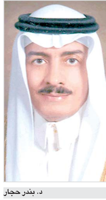
د. بندر حجار

مكة المكرمة - خالد الحسيني ابدى معالي د. بندر محمد حجار وزير الحج ارتياحه للعديد من الإجراءات والخطط التي نفذتها الوزارة في خدمات الحج والعمرة.. وزير الحج تحدث لـ "البلاد" عن عقوبات "التشهير" التي وافق عليها مجلس الوزراء اول امس الاثنين وقال ان التطبيق من تاريخه والتي تتعلق بخدمة حجاج الداخل ونقل الحجاج الى المملكة واعادتهم الى بلادهم وتنظيم خدمات المعتمرين وغيرها وقال ننووع استقبال مليون واربعمئة الف حاج من الخارج هذا العام ومانتي الف من الداخل . و اضاف الوزير عدا غير النظاميين .. وسألت "البلاد" الوزير عن عودة اعداد حجاج الخارج بعد انتهاء توسعة الطواف حسب النسبة؟ .. قال المؤمل ان يعود العدد مع انتهاء الاسباب التي ادت لتخفيض العدد من الخارج والداخل.