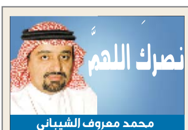
نصر اللهم محمد معروف الشيباني

جدة - البلاد رحبت منظمة التعاون الإسلامي بالدعوة التي تلقتها من المملكة العربية السعودية. لعقد اجتماع طارئ لوزراء خارجية الدول الأعضاء في المنظمة، وذلك لمناقشة الانتهاكات الإسرائيلية في مدينة القدس المحتلة، وبحث الوسائل لوقف الاعتداءات الإسرائيلية على المسجد الأقصى المبارك. وأكد معالي الأمين العام لمنظمة التعاون الإسلامي