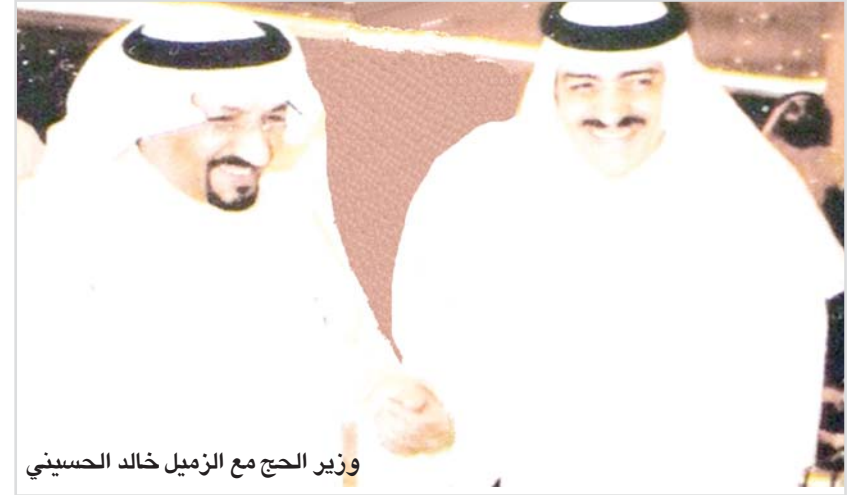
وزير الحج مع زميل خالد الحسيني

أبدى معالي د. بندر محمد حجار وزير الحج ارتياحه للعديد من الإجراءات والخطط التي نفذتها الوزارة في خدمات الحج والعمرة.. وزير الحج تحدث لـ "البلاد" عن عقوبات "التشهير" التي وافق عليها مجلس الوزراء أول أمس الاثنين وقال أن التطبيق من تاريخه والتي تتعلق بخدمة حاج الداخل ونقل الحجاج إلى المملكة وإعادةهم إلى بلادهم وتنظيم خدمات المعتمرين وغيرها وقال تتوقع استقبال مليون واربعمائة الف حاج من الخارج هذا العام ومائتي الف من الداخل . وأضاف الوزير عدداً غير النظاميين .. وسألت "البلاد" الوزير عن عودة أعداد حجاج الخارج بعد انتهاء توسعة الطواف حسب النسبة؟ .. قال المؤمل أن يعود العدد مع انتهاء الأسباب التي أدت لتخفيض العدد من الخارج والداخل.