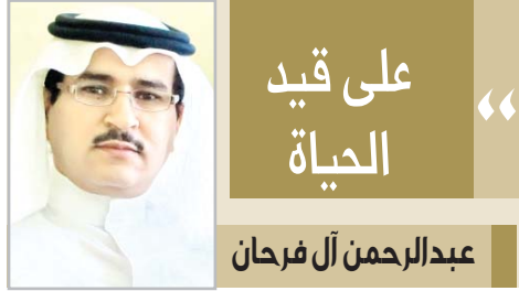
علي قيد الحياة