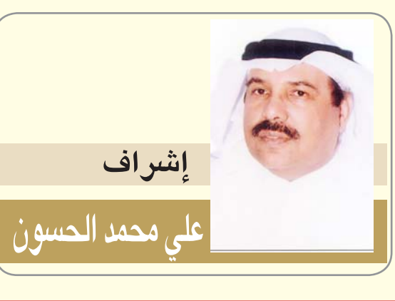
إشراف علي محمد الحسون

انه محمد حسن عبد الغني بعيداً عن رتبة - لواء - التي يحملها على كتفيه تقانيا في خدمة بلاده بكل جدارة وبذل وطاء.