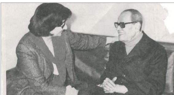
القاهرة - البلاد

من حسن حظي انني التقيت الاثنين صاحب نوبل الاديوب العالمي الكبير نجيب محفوظ والكتابة الرموقة ثناء البيسي .. والسدي لا يعرف الكثيرون ان الاديوب نجيب محفوظ (صاحب نكتة) وهو على استعداد لسماع النكتة والبناء عليها من اولاد البلد ويحكي من اصدقائه الحرافيش ومنهم الفنان احمد مظهر والمكثور يحيى الرخاوي واخرين وان مشواره اليومي من بيته في (حي العجوزة) بمصر حتى جريدة الاهرام كان لسماع اقوال ومشاهدة افعال (اولاد البلد) وتسجيلها في ذاكرته والكتابة عنهم عندما يهم بالكتابة.. اما تلاميذه مثل الاديوب والصحفي جمال الغيطاني والاديوب يوسف القعيد فقد احبهم نجيب محفوظ الذي تحتفل مصر حاليا بذكراه وتقدر لذلك صحيفة الاهرام لمجموعة من اهم اعماله اما الكتابة