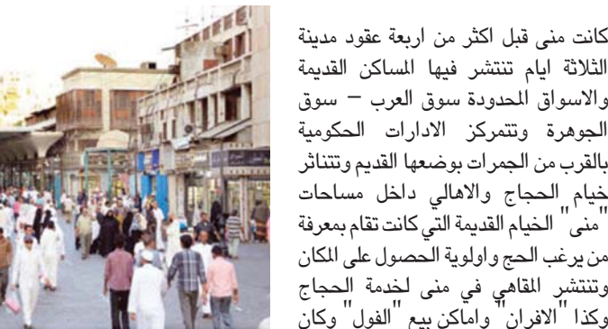
اسواق منى القديمة

والهندسية .. اليوم منى وصلت لدرجة كبيرة من تطور الخدمة ولا زالت هناك مشاريع مستقبلية سيتم تنفيذها في منى لتتضمن الخدمات وتطوير الاداء .. اليوم منى على استعداد ان يطلق عليها مدينة منى قديماً