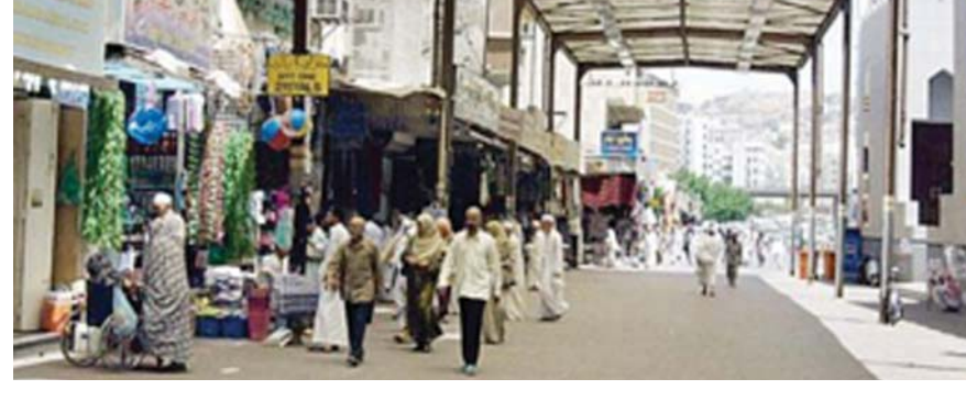
سوق المدعي في مكة

سنوات طويلة كان سكن الحجاج في منطقة "البلد" القريبة من المسجد الحرام المدعي - الشامية - حارة الباب - الشيبكة - المسطة - جباد - الغزة - شعب عامر لاداء الصلاة والطواف يوميا .. منذ سنوات وصل سكن الحجاج الى العزيزية والششة والعبادة خاصة بعد تحسين شبكة الطرق .. كان السوق الرئيسي للحجاج الي ما قبل اربعة عقود المدعي وشارع فيصل والنتشية والغزة وسوق المعلا تجد في هذه الاسواق كل ما يريده الحاج من مطاعم او اقمشة او هدايا لذلك ظلت هذه الاسواق تحقق مواقع ذهبية وارباح عالية. لكن هذه الاسواق اندثرت بعد تنفيذ مشاريع التوسعة