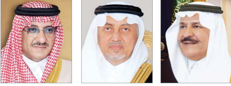
الأمير Nayef بن عبدالعزيز الأمير خالد الفيصل الأمير محمد بن Nayef

يسجل التاريخ وذاكرة الحج العديد من الاسماء التي قدمت خدمات كبيرة لصيوف الرحمن بعض هؤلاء ظل سنوات طويلة .. ولا يمكن حصر كل الاسماء من الاجهزة المدنية والعسكرية لكن اسجل لكم من الذاكرة "اسماء مضيئة كانت لهم جهودهم وكان لهم حضورهم وتفاعلهم في العمل في خدمة الحاج .. بل ان اكثر هؤلاء كان خلف تدريب كوادر بشرية تحتل مواقع هامة في تقديم خدماتها للحج.