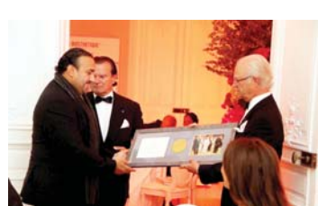
ملك السويد يكرم مؤسسة الملك عبدالله للأعمال الإنسانية

الرياض - البلاد كرم ملك السويد كارل جوستاف السادس عشر الرئيس الفخري لصندوق التمويل الكندي العالمي ، مؤسسة خادم الحرمين الشريفين الملك عبدالله بن عبدالعزيز آل سعود العالمية للأعمال الإنسانية ، تقديراً من جلالته للدم الكبير الذي قدمه - المغفور له بإذن الله - الملك عبدالله بن عبدالعزيز آل سعود للكشفة وتأسيسه برنامج رسل السلام العالمي. وتم التكريم خلال حفل العشاء السنوي لكبار داعمي مؤسسة الكشفة العالمية ، الذي أقيم يوم أمس الأول في مكتب رئيس مجلس إدارة الصندوق الكندي السيد سيقفريد وايزر في العاصمة الفرنسية باريس بحضور مجلس إدارة الكشفة العالمية ومجموعة من كبار داعميها من أنحاء العالم ومن كبار الخلفين عالمياً ومنهم المستشار العليار رئيس فرنسا ، والرئيس السابق للبنك المركزي الإيرلندي .