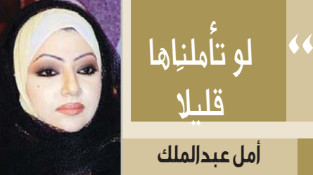
أم عبد الملك

لو تأملناها قليلاً أثناء تصفحي الاستجمام وهو أحد برامج شبكات التواصل الاجتماعي لفت نظري " بوست صورة في حسابات أحدهم يتحدث عن قواعد التعامل الإنساني حسب ما ورد في القرآن الكريم وتحديداً سورة الحجرات المتكررة من ثماني عشرة آية ، فتأملت ما ورد في الصورة للحظات ورغم أنني قرأت سورة الحجرات مئات المرات إلا أنني هذه المرة قرأتها بعين مختلفة وإحساس عميق ففتحت المصحف الكريم وكررت قراءة الآية السورة وركزت على الآيات التالية التي تبدأ من الآية السادسة إلى الآية الثامنة عشرة تقريباً ، وأول قاعدة في التعامل مع الآخرين كانت: " يَا أَيُّهَا الَّذِينَ آمَنُوا إِن جَاءَكُمْ فَاسِقٌ بِنَبَأٍ فَتَبَيَّنُوا أَن تُصِيبُوا قَوْمًا بِجَهْلَةٍ فَتُصْحَبُوا عَلَيْهِمْ فَإِذَا تبَيَّنُوا أَنَّهُمْ قَوْمٌ عَادُونَ فَاصْلَحُوا لَهُمْ إِنْ عَادُوا وَإِلَى اللَّهِ الْمَصِيرُ " .