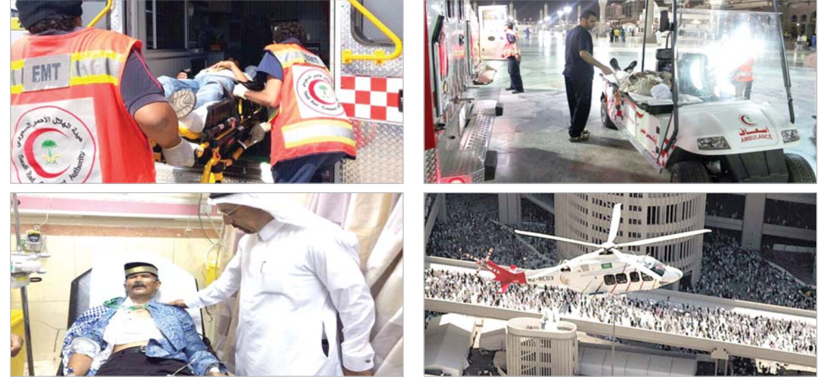
استعدادات كبرى في وزارة الصحة لخدمة ضيوف الرحمن.. (ص ٤/٥)