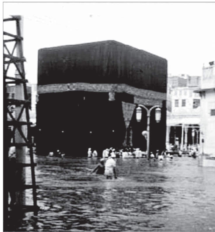
أمطار داخل الحرم