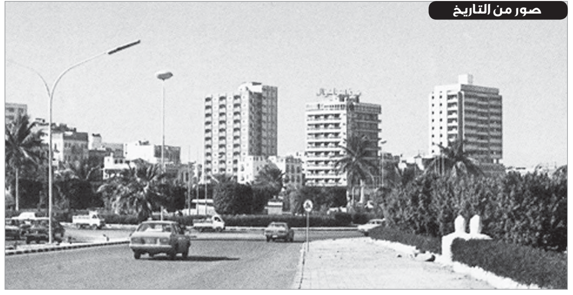
جدة / طريق المدينة المنورة النازل ( حيث ترى أمامك دوار البيعة )