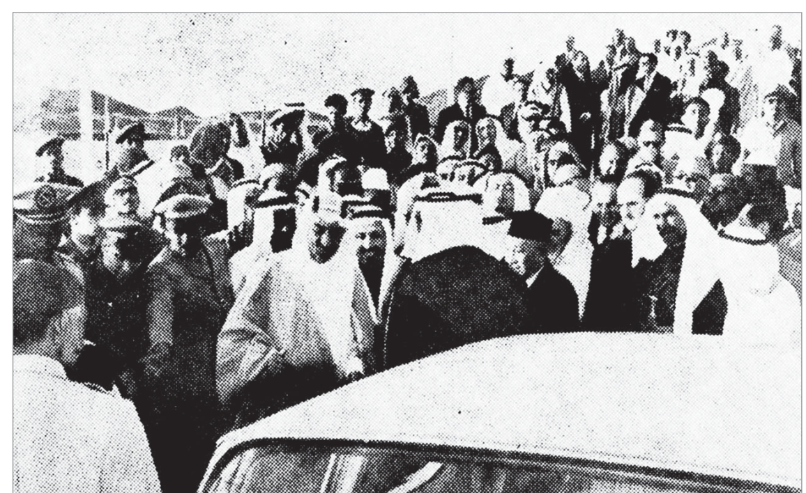
أعضاء من السلك الدبلوماسي يحيون جلالة الملك في حفل تدهين المشروع الانذاعي