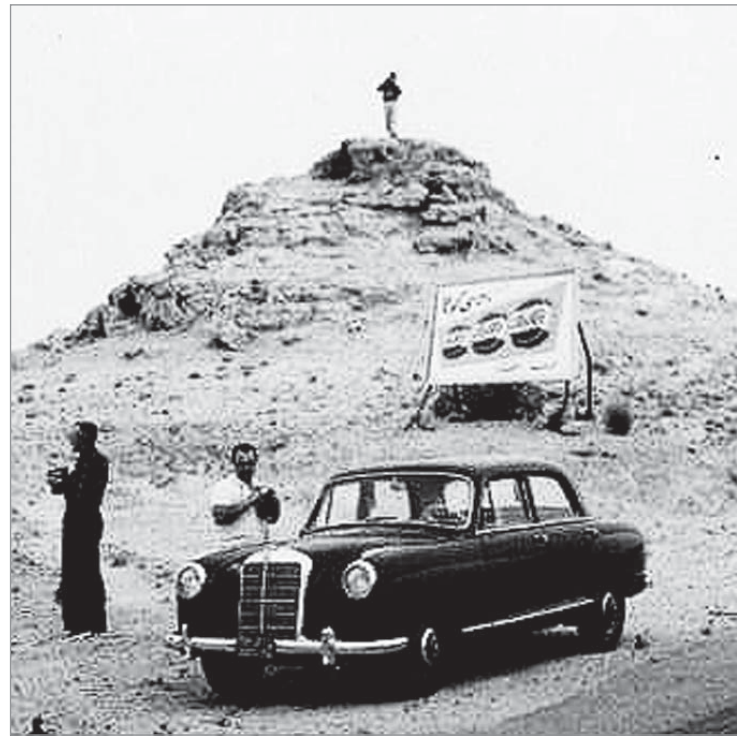
الخرج السبعينات الميلادية