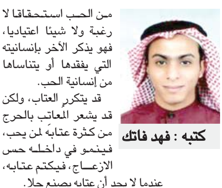
كتبة: فهد فاتك

من الحب استحقاقاً لا رغبة ولا شيئاً اعتيادياً، فهو يذكر الآخر بإنسانيته التي يفقدوها أو يتناساها من إنسانيته. قد يتكرر العتاب، ولكن قد يشعر المعاتب بالحرج من كثرة عتابه لمن يحب، فيتمسك في داخله حسن الإزعاج، فيحتم عتابه، عندما لا يجد أن عتابه يصنع حلاً. عندما يكون المعاتب يتعامل مع الموضوع مثل الاعتذار لا أكثر، مثل يجد عذره وأسفه وسيلة للتخلص من العتاب وليس لحله أو إخماده. هنا يبدأ الجرح يكبر، لأن الجرح لا يتغير بشدة إلا غير صاحبه، حتى أولئك الذين كانوا يتألمون من جراح الآخرين لم يعد لهم وجود، حتى أولئك الذين يحبون ويبكون لم يعد يبكون عندما يجرحون غيرهم لأنهم وجدوا