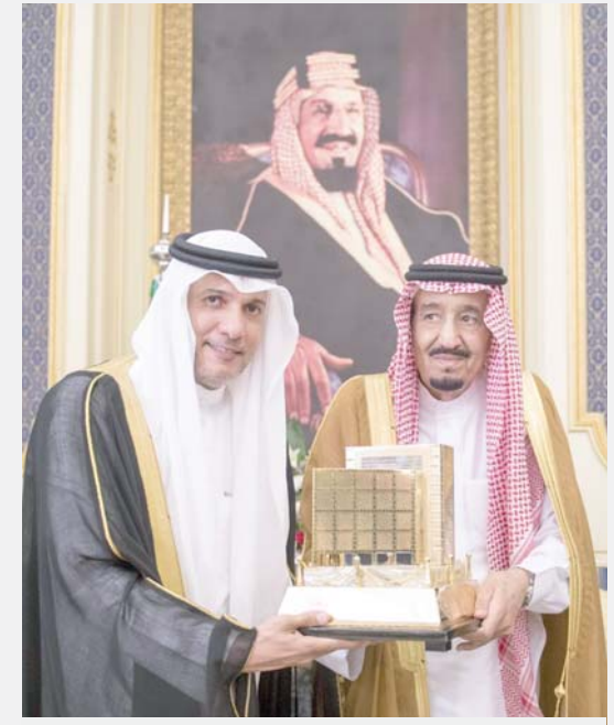
خادم الحرمين الشريفين يسلم موقف جمال الجائزة