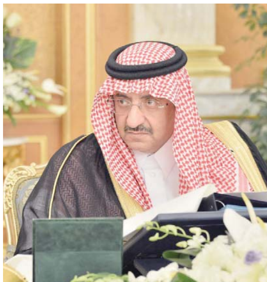
نائب الملك يرأس جلسة مجلس الوزراء